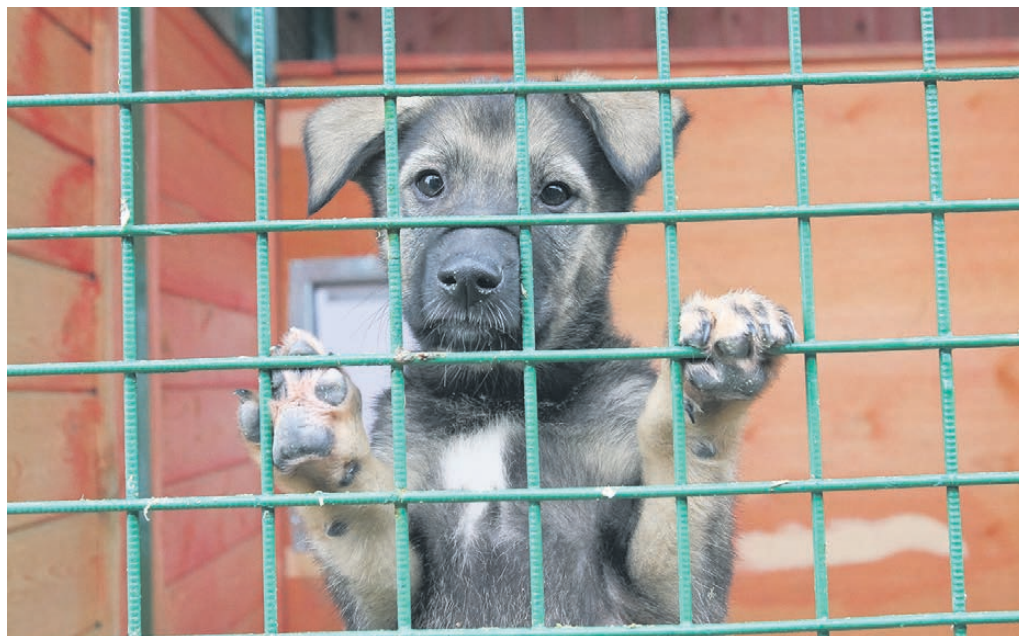
ВОЗВРАТ. Часто хозяева берут питомца из приюта на эмоциях, а позже понимают, что в их образ жизни кошка или собака не вписывается. Ничего постыдного в этом нет. Правильнее признать свою ошибку и вернуть животное в приют. Это лучше, чем выкинуть на улицу или попытаться пристроить самостоятельно.