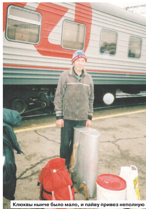
Клюквы нынче было мало, и пайву привез неполную

В этот раз я хорошо отдохнул, вдоволь походил по тайге, надышался чистым воздухом, пообщался с незнакомыми людьми. Отдохнул от телевизора и черных новостей, от машин и цивилизации. Возвращаясь домой, сделал вывод: как бы ни приятно была весенняя вылазка, в мои годы в тайгу лучше ездить не весной, когда возможны пожары и частые возвратные холода, а осенью.