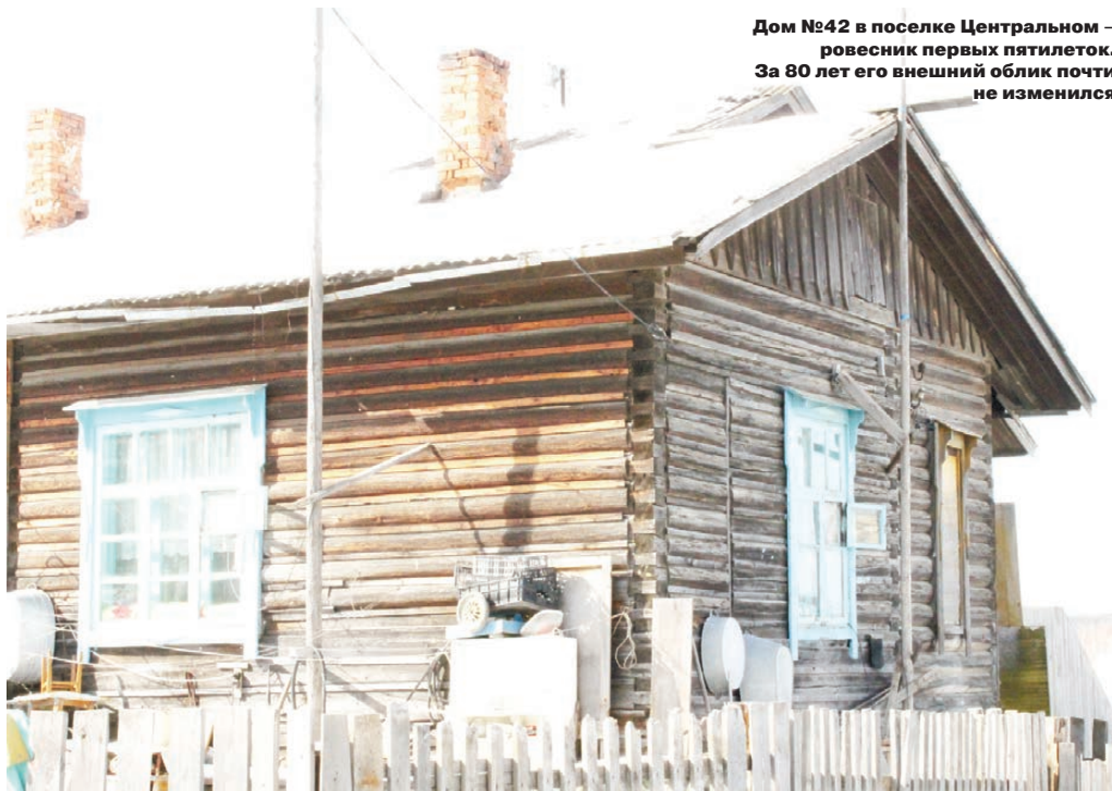
Дом №42 в поселке Центральном — ровесник первых пятилеток. За 80 лет его внешний облик почти не изменился

Согласно приказу Госстроя №177 («Об утверждении методики по определению непригодности жилых зданий и жилых помещений для проживания»), срок службы зданий IV группы капитального строительства составляет 50 лет. Дома-ветераны в Центральном поселке в будущем году отметят 80-летие. Преклонный возраст стен, перегородок, перекрытий, фундамента, кровли дважды оценила экспертиза, которую, как считают жильцы, мэрия игнорирует.