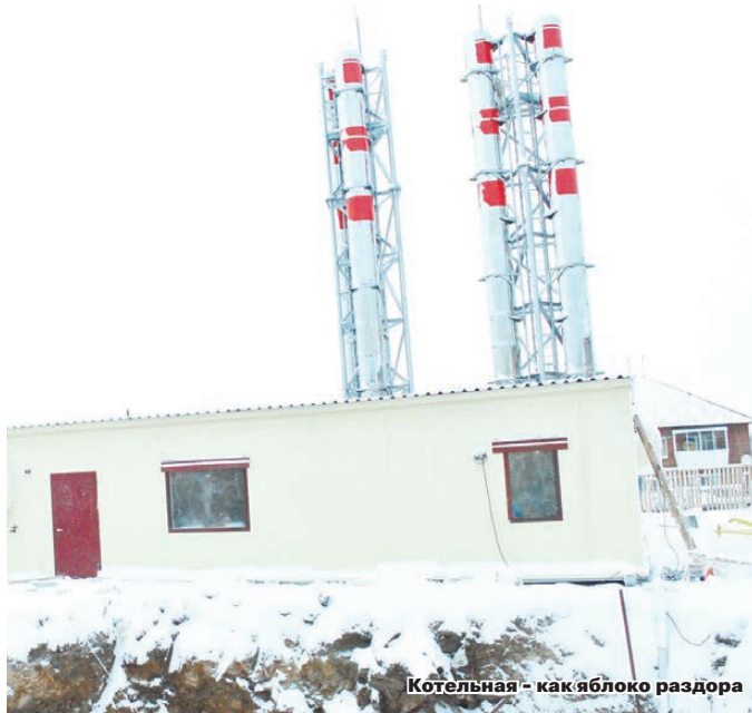
Котельная — как яблоко раздора

— Да, жители обращались в прокуратуру, писали письма президенту. Прокуратура проводила проверку: изучались документы на строительство котельной. Санитарно-защитная зона подразумевает влияние на человека вредных факторов, которые, конечно, нужно исключить. Согласно анализу расчетов рассеивания вредных веществ, все должно быть, мы считаем, в пределах нормы. Но если жители чувствуют запах газа, то об этом им нужно обязательно сообщать в Березовские тепловые сети, горгаз и Единую дежурно-диспетчерскую службу. Потому что так не должно быть.