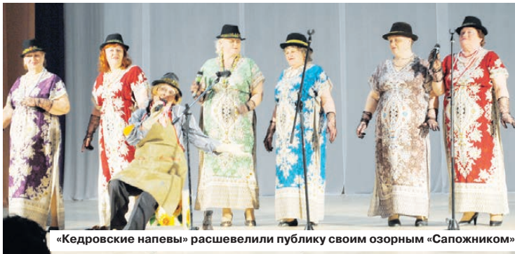
«Кедровские напевы» расшевелили публику своим озорным «Сапожником»

В этом году открытый городской конкурс «Рабочей песни», который в Берёзовском проводится третий год подряд, стал соревнованием между бюджетниками. На обновленную сцену ДК «Современник» 24 апреля вышли воспитатели детских садов, учителя, работники военкомата. Поющий «женский батальон» разбавили несколько представителей сильного пола. Поболеть за своих наставников пришли ученики и детсадовцы. К сожалению, участников было едва ли не больше, чем зрителей в зале, хотя вход на гала-концерт был свободный. Самодеятельных артистов не смутило отсутствие аншлага: они отвели душу не в караоке-баре, а на сцене Дворца культуры.