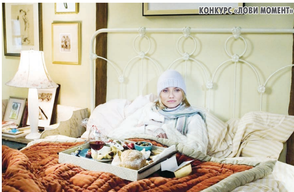
КОНКУРС «ЛОВИ МОМЕНТ»

На прошлой неделе, к сожалению, кадр из фильма «Гостья» никто не угадал.