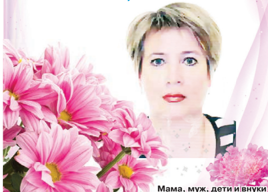
Мама, муж, дети и внуки

Ты для нас – солнышко ясное, Самая лучшая и прекрасная! Мы поздравляем тебя с днем рождения, В жизни желаем только везения! Рассветов багряных, хорошей погоды Желаем тебе мы на долгие годы! Пусть счастье тебя обнимает сильнее, Любимая, с юбилеем!