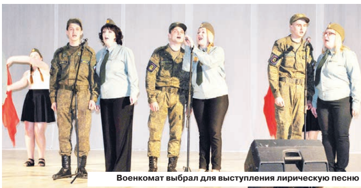
Военкомат выбрал для выступления лирическую песню