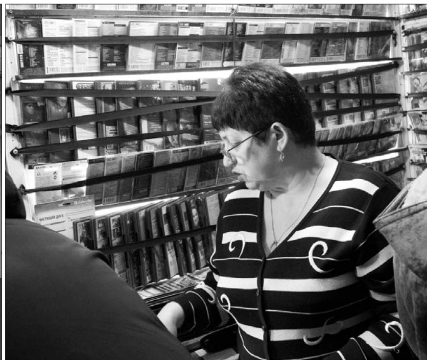
* К визиту оперативников продавец отнеслась спокойно.

Всего с начала года сотрудниками ОБППР при УВД Нижнего Тагила и Горноуральского городского округа проведено 28 проверок. Их цель - выяв-