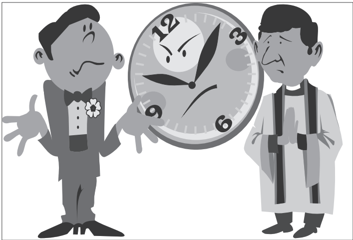
Иллюстрация Петра УПОРОВА.

*** – Без еды можно прожить месяц. – Можно – а смысл? – А без смысла можно прожить всю жизнь.