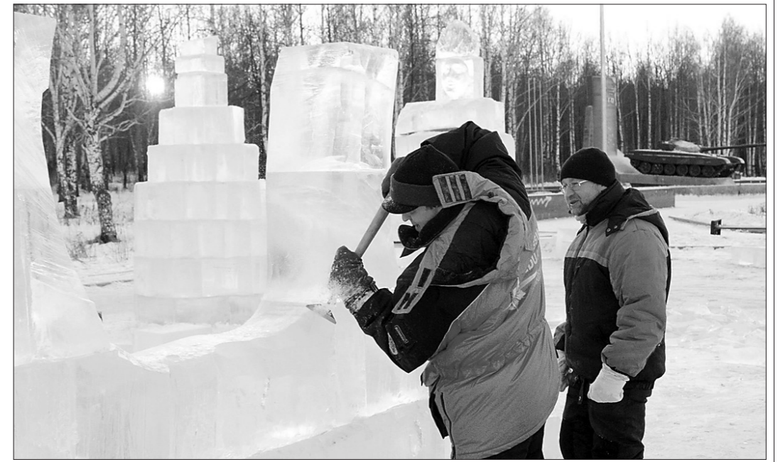
* В минувшие выходные началось строительство ледового городка.

При низком тарифе на содержание жилья компания ищет эффективную структуру и оптимальный состав сотрудников. Снизить затраты и улучшить качество обслуживания позволило, во-первых, создание своей аварийной службы. Она расположена непосредственно на территории обслуживания, на улице Алтайской, 51,