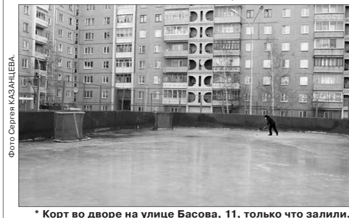
* Корт во дворе на улице Басова, 11, только что залили.