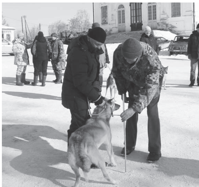
Мерять рост никому не нравится...

Охотиться с лайкой можно буквально на любого зверя. Поэтому в качестве приза за первое место победителю вручили путевку на кабана (стоимость – 15 тысяч рублей), за