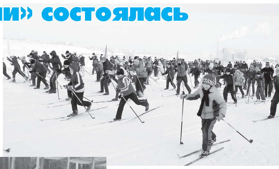
Vir-забег набирает обороты.