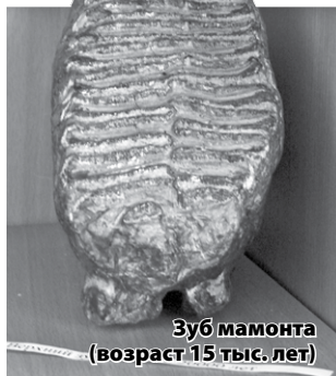
Зуб мамонта (возраст 15 тыс. лет)