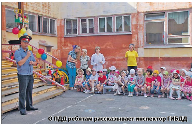
О ПДД ребятам рассказывает инспектор ГИБДД

Для ознакомления воспитанников с правилами личной, пожарной безопасности, ПДД в группах оформлены уголки безопасности, где имеется соответствующий дидактический материал (игры, тематические альбомы, фотографии и картинки с изображением дорожных знаков). Педагогами групп широко используется наглядный материал – яркие выразительные плакаты, иллюстративный материал, пособия, буклеты.