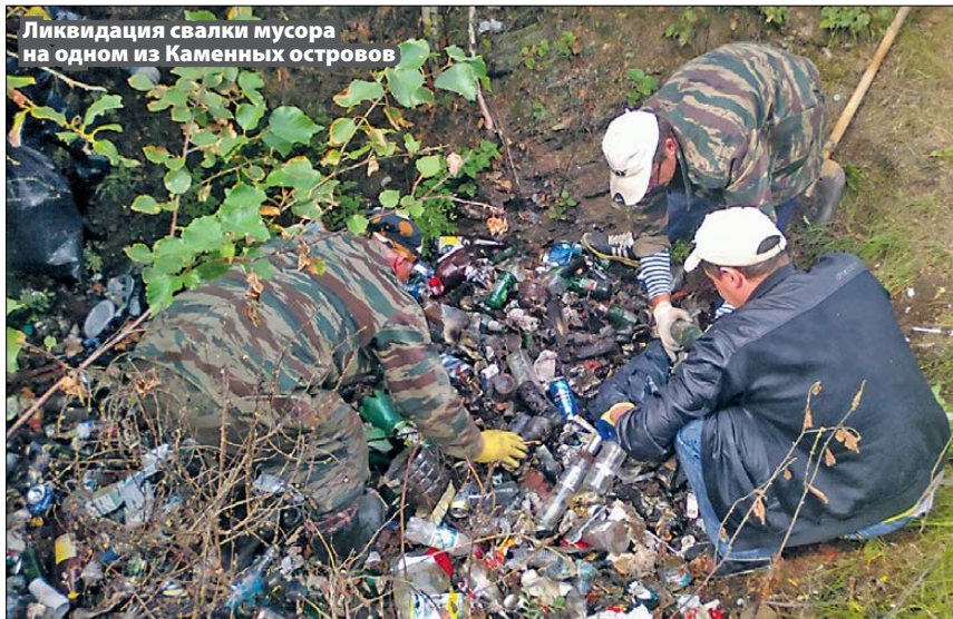
Ликвидация свалки мусора на одном из Каменных островов