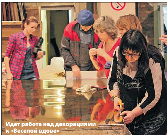
Идёт работа над декорациями к «Веселой вдове»

– Мы стараемся содержать театр в хорошем техническом состоянии: было проведено несколько серьёзных ремонтных работ. В прошлом году отремонтировали балкон, и сегодня у нас полноценный зрительный зал на