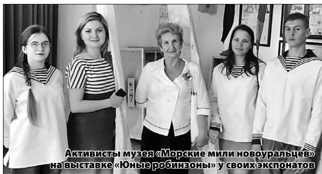
Активисты музея «Морские мили новоуральцев» на выставке «Юные робинзоны» у своих экспонатов

Помимо церемонии чествования победителей и призеров смотра-конкурса, в программу слета была включена экскурсия в музей истории Екатеринбурга. Там юные краеведы посетили две выставки. Первая называется «Эвакуация» и рассказывает о предприятиях и их работниках, эвакуированных после начала войны в Свердловск. Ребята узнали очень много нового. Напри-