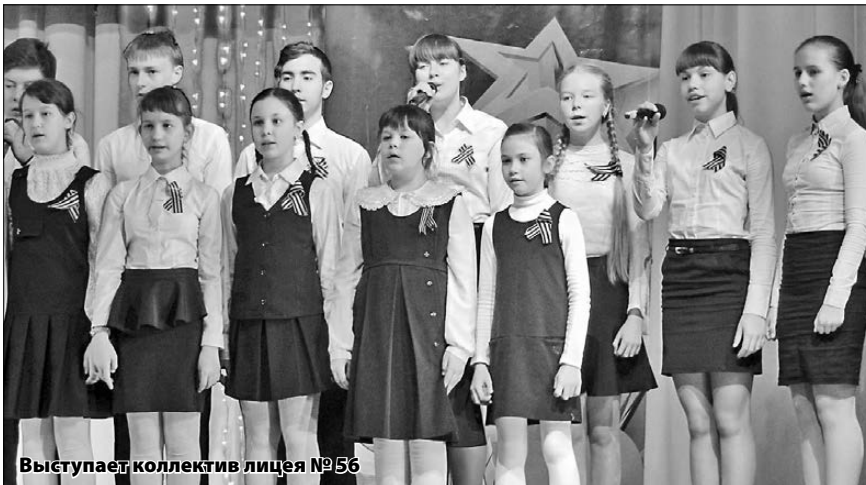
Выступает коллектив лицея №56

пели дети и подростки, вызывая у зрителей слёзы.