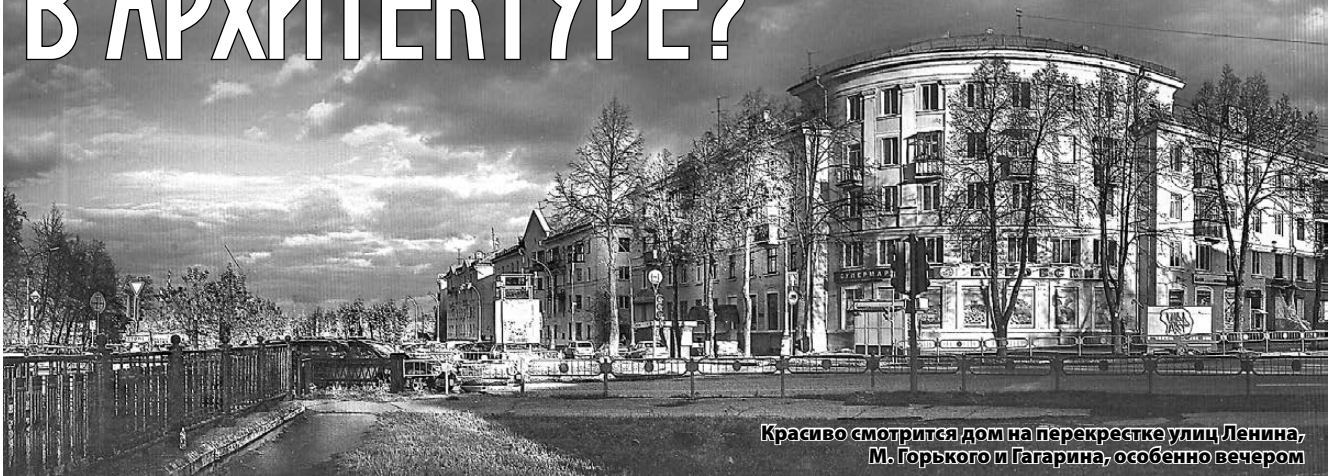
Красиво смотрится дом на перекрестке улиц Ленина, М. Горького и Гагарина, особенно вечером

Газетная публикация об улицах старой части города послужила поводом для того, чтобы поразмышлять над архитектурным обликом Новоуральска и необходимостью сохранить в первоначальном виде здания на улицах Горького и Гагарина. Они образуют некое историческое кольцо.