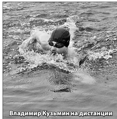
Владимир Кузьмин на дистанции