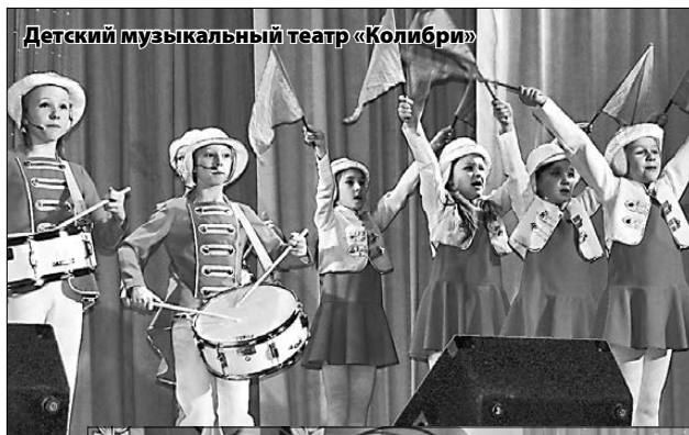
Детский музыкальный театр «Колибри»