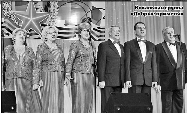
Вокальная группа «Добрые приметы»

могли поверить, что в России есть такое мощное и эффективное производство по обогащению урана. «Это производство – наше общее достижение и общая победа», – подытожил Вадим Раев.