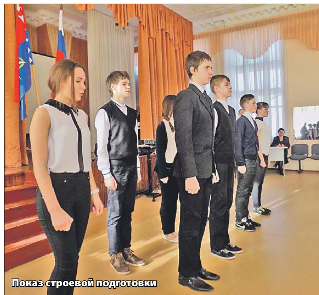
Показ строевой подготовки

Многое зависело от командиров, среди которых, нужно отметить, было много девушек: их уверенность передавалась всем кадетам, а четкость отдаваемых ими команд отражалась на результатах показательных выступлений всего класса. Не у всех получалось вышагивать в ногу, держать ровный строй, разворачиваться в нужную сторону, попадать в ноту во время исполнения строевой песни. Совершаемые ошибки расстраивали ребят, и после выступления они вместе эмоционально обсуждали каждый промах. И это лишь подтверждало тот факт, что строевая подготовка в первую очередь учит работать в команде.