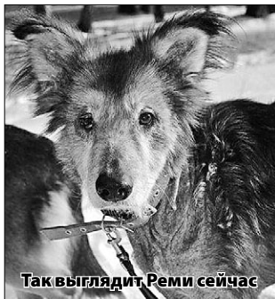
Так выглядит Реми сейчас

В конце прошлого года Ольга нашла на трассе сильно травмированного, наполовину лысого пса, которого она назвала Реми. Лечение для него оказалось сложным и дорогостоящим, и люди, к счастью, откликнулись и помогли Ольге и ее подопечному. Сейчас состояние Реми улучшилось, постепенно он обрастает шерстью, но средства на передержку и лечение собаки заканчиваются. К тому же много денег и сил затрачивается на строительство приюта.