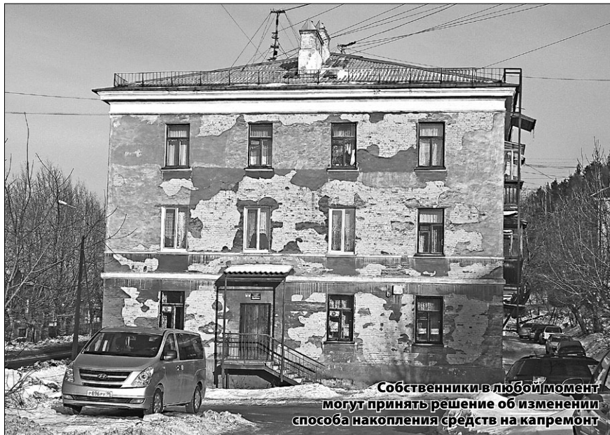
Собственники в любой момент могут принять решение об изменении способа накопления средств на капремонт

– Чаще других задаются вопросы по капитальному ремонту общего имущества многоквартирных домов, по фонду накопления средств на капитальный ремонт. В своё время было много публикаций, в том числе и в вашей газете, по новой региональной программе капитального ремонта. Но, как выясняется, до многих людей эта информация почему-то не дошла.