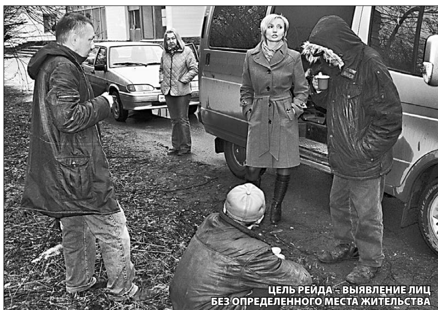
ЦЕЛЬ РЕЙДА – ВЫЯВЛЕНИЕ ЛИЦ БЕЗ ОПРЕДЕЛЕННОГО МЕСТА ЖИТЕЛЬСТВА