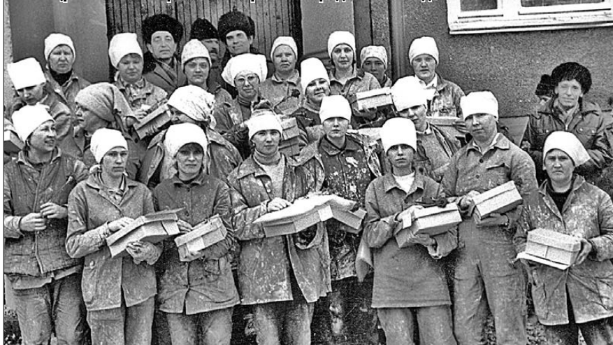
Участники конкурса мастерства по отделочным работам с поощрительными призами – тортами. Середина 80-х годов