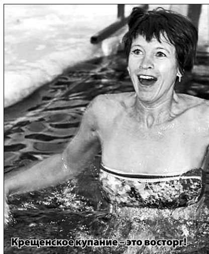
Крещенское купание – это восторг!

Владимир ПАВЛОВ