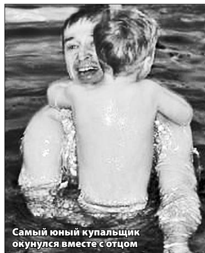
Самый юный купальщик окунулся вместе с отцом