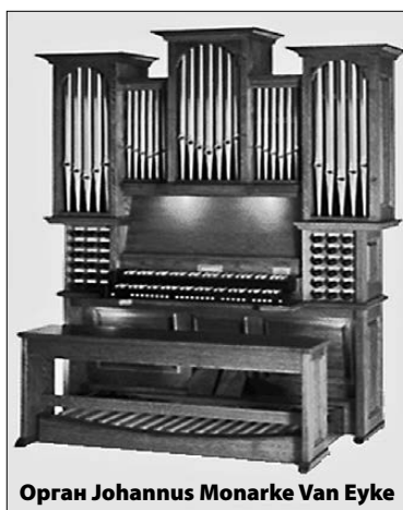
Орган Johannus Monarke Van Eyke

На минувшей неделе в ДШИ, в том самом зале, где предполагается установить инструмент, прошла торжественная церемония, на которой был дан официальный старт благотворительной акции и состоялось символическое открытие баннера с изображением Johannus Monarke Van Eyke в натуральную величину. Гости церемонии смогли оценить его