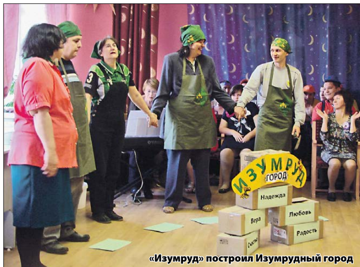
«Изумруд» построил Изумрудный город