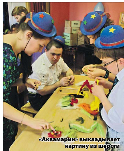
«Аквармарин» выкладывает картину из шерсти

Разнообразными и яркими гранями своего творчества сверкнули перед жюри и гостями участники конкурса мастерства «Сияние самоцвета», прошедшего недавно в автономной некоммерческой организации «Благое дело». Проводился он в рамках реализации проекта «Социальный лифт в профессиональное будущее» – технология подготовки взрослых инвалидов с психическими нарушениями к трудовой деятельности».