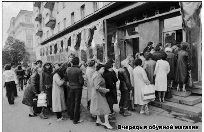
Очередь в обувной магазин

Но что-то вмешалось в ход истории. Предпринимательство все меньше и меньше манит возможностью хорошо заработать. Много хлопот, а отдача не всегда адекватна вложенным силам