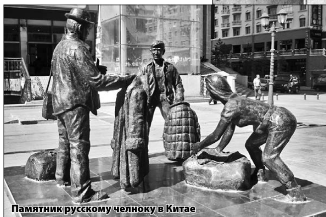
Памятник русскому челноку в Китае