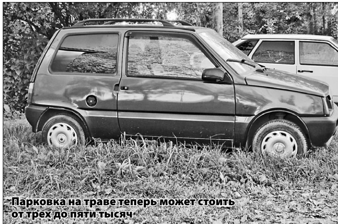
Парковка на траве теперь может стоить от трех до пяти тысяч

– Вполне реально. Пусть это будет не так капитально, как если бы парковку строила какая-нибудь подрядная организация. Но сделать отсыпку и твёрдое покрытие из пыли или щебня группе частных инвесторов вполне по силам. Мы не требуем обязательного наличия бордюров, асфальта, потому что для нас главное, чтобы не было выноса грязи на проезжую часть. В обустройстве парковки за свой счёт есть, правда, щепетильный момент: на неё могут начать ставить машины те, кто в строительстве не вкладывался. И формально запретить им это нельзя. Дело в том, что земля под парковкой является придомовой территорией, и права на неё у всех собственников жилья одинаковые. Поэтому с теми, кто будет ставить машины, так сказать, на халяву, придётся