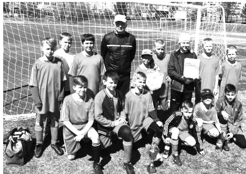
После турнира в Кушве

Очень активное начало сезона получилось у наших ребят, впереди и областные соревнования.