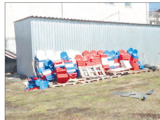
Неисправные сиденья болельщиков заменяют на новые, но цвет триколора на трибунах обязательно сохраняют.