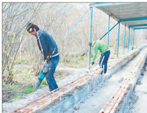
На трибунах уже начали бурить ямы для установки дополнительных опор, чтобы крышей закрыть все ряды кресел для болельщиков.