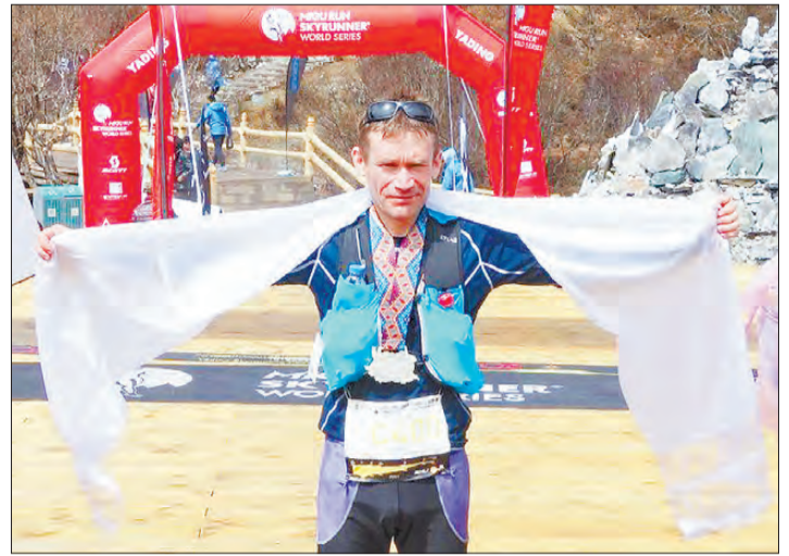
Финиш в Тибете, на высоте четыре тысячи метров

Пишите: gorka-info@rambler.ru Звоните по тел. (343) 247-83-34, сот. 8-900-204-19-61 Наш сайт: zg66.ru