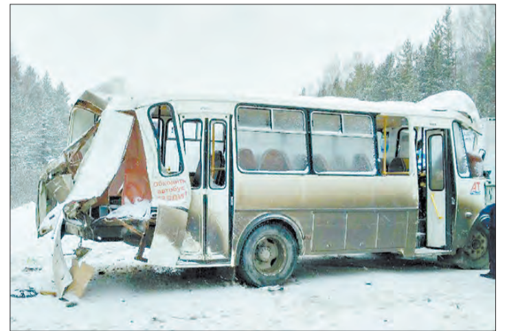
Мартовская авария с автобусом на режевском тракте не должна повториться при перевозке детей в период летних каникул.

Возбуждением уголовного дела по статье уголовного кодекса «Мошенничество в сфере кредитования» обернулась для молодого человека попытка обмануть банк. 3 мая в салоне «Связной» на улице Анучина он предоставил при оформлении кредита на покупку заведомо подложные сведения о месте работы и уровне заработной платы. Таким образом, он попытался обмануть кредитную организацию на сумму 71539 рублей. Однако хитрость не прошла даром — обман быстро вскрылся, и сейчас за попытку обмануть банк на значительную сумму обманщику могут присудить до двух лет исправительных работ или наказать крупным штрафом.