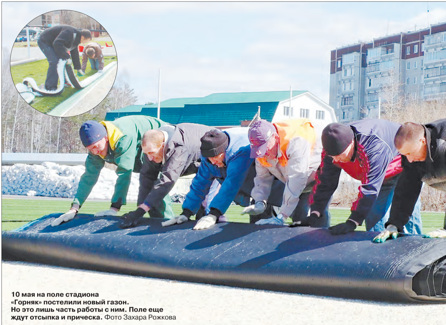
10 мая на поле стадиона «Горняк» постелили новый газон. Но это лишь часть работы с ним. Поле еще ждут отсыпка и прическа.

В это время рабочие тащат на поле деревянные поддоны и чем-то тяжелым наполненные мешки. Зачем? Оказывается, они выравнивают клейки разметочных линий.