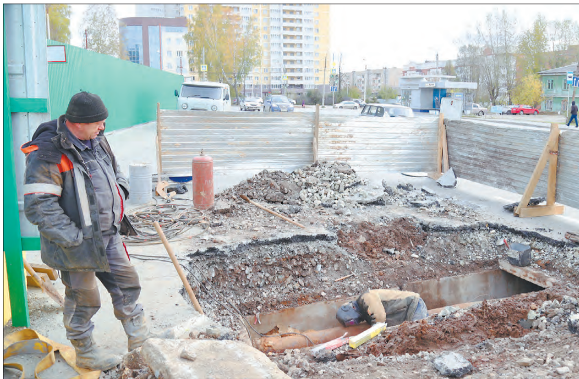
В прошлом году аварию на сетях у храма ликвидировали осенью.

По сообщениям Департамента информационной политики Свердловской области