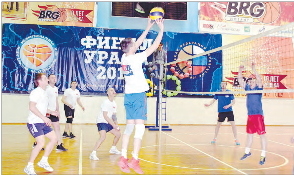
Волейболисты из группы компаний «Брозекс» не оставили четверым своим соперникам шансов на победу.

Ближайшие планы Пестича и Сенаторовой – выступление в составе сборной страны на этапе Кубка Европы среди кадетов (до 18 лет), который пройдет 24-26 мая в Португалии.