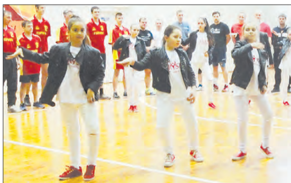
Танцем открывала спартакиаду команда школы Crystal.