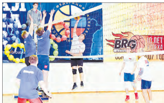
Спортсмены из «Флагмань» старались, но в тройку лидеров не попали