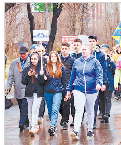
Ребята из 2-й школы (слева) и другая группа бегают победно.