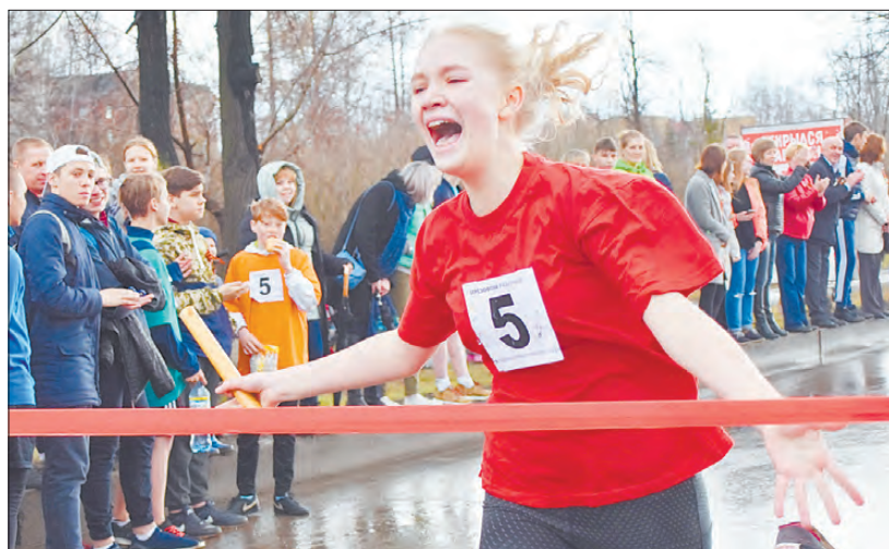
Эмоции финиша: метрам этапа отданы силы, эмоции и ленточка, как символ долгожданной победы