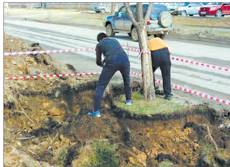
Обкапывать корни деревьев все-равно пришлось вручную, лопатой

— По проекту на этом месте должны возникнуть парковочные карманы. Это сейчас кажется, что парковочных мест для жителей достаточно, но следует учесть рост количества автомобилей в городе. На первых этажах этих домов находятся магазины, а большая парковка — на противоположной стороне. Делать здесь пешеходный переход нет смысла, их два есть, но чуть в стороне, — ответил начальник МКУ Алексей Емелин.