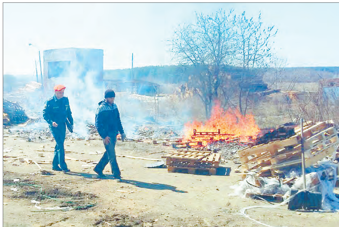
Сотрудники Госпознадзора удивляются отчаянности некоторых горожан. Люди разводят открытые костры не имея поблизости ни огнетушителей, ни воды.

Стражи порядка провели проверку и установили, что один из участников вечеринки выкрал ключи у владельца автомобиля. А после быстро и недорого продал украденный автомобиль. Теперь за кражу с причинением значительного ущерба ушлому собутыльнику грозит до пяти лет лишения свободы.