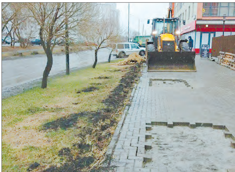
Без крупной техники не обойтись в пересадке крупных деревьев, заказали погрузчик и манипулятор