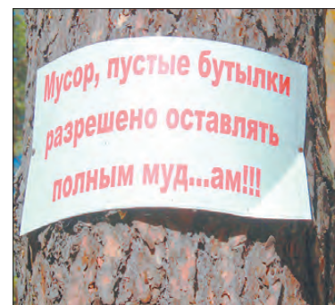
Лесная социальная реклама.

Зафиксированы первые случаи заболевания клещевыми энцефалитом и боррелиозом. С первым предварительным диагнозом госпитализированы трое, со вторым – 17 человек.