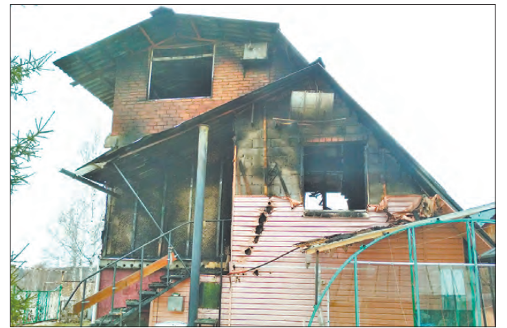
По словам хозяев, кроме электрического обогревателя и холодильника накануне пожара в доме ничего не было включено в сеть.

— Он почувствовал сильное недомогание, но денег на «лекарство» не было. Поэтому, выломав доски в заборе, он вытащил колёса с участка, погрузил их на садовую тачку, которую нашёл тут же, и, отвезя на соседнюю улицу — продал, — раскрыли криминальный сюжет в полиции. Столь нехитрые соседские отношения резюмирует теперь уголовное дело по статье «Кража».