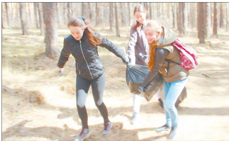
Одной из находок волонтеров стала целая поляна разбросанных «фунтыриков». На небольшой площадке их валялось не менее сорока штук.