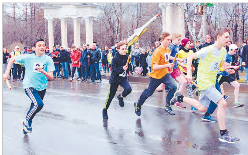
Идет забег средней группы. Ребятам повезло — дождь прекратился.