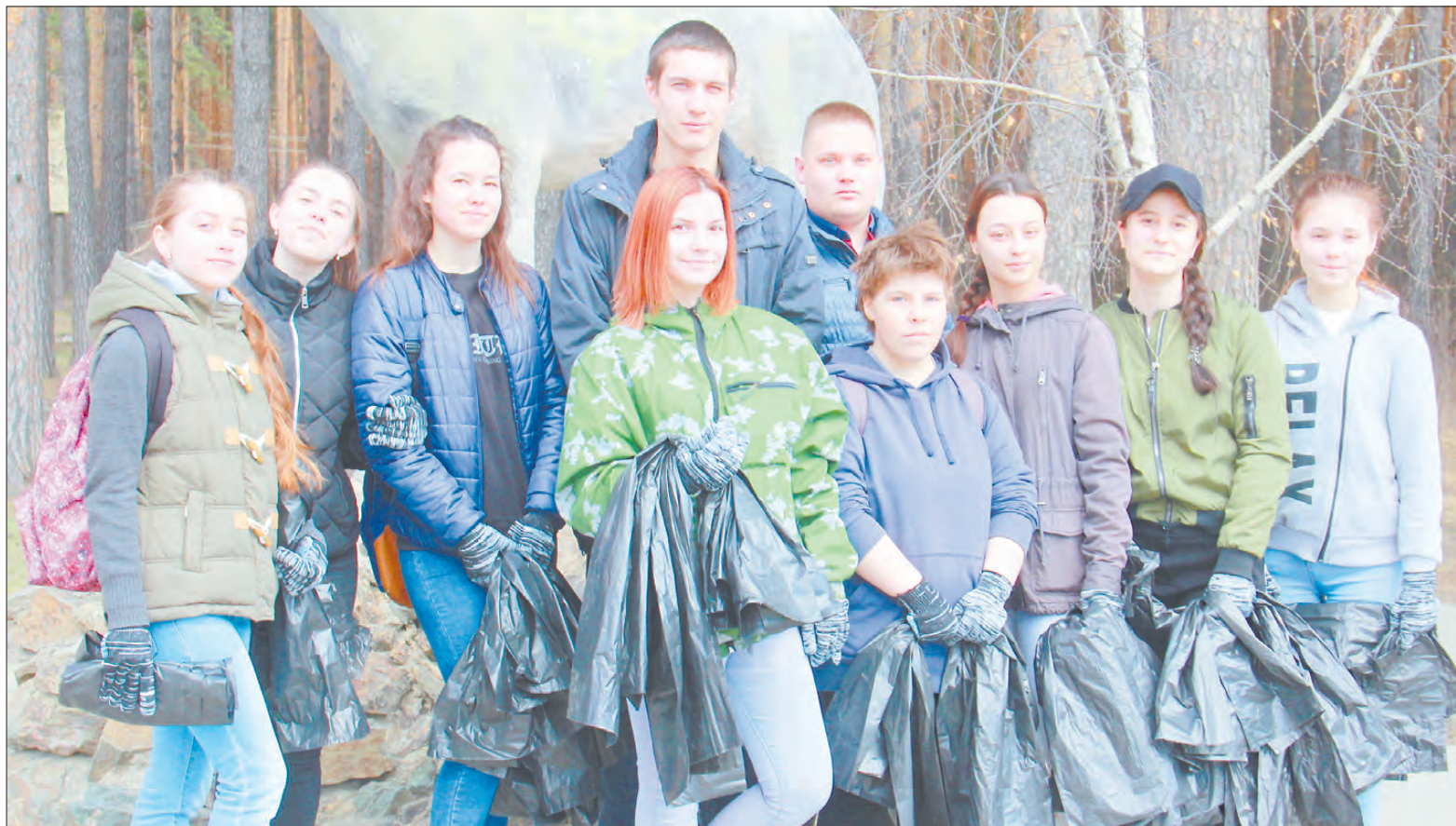
Молодые активисты сообщества «Родина золота». Они пришли на место сбора одни из первых и были уверены, что общегородской субботник соберет раза в два больше березовчан.

Рекламная служба: (343) 247-83-34, ул. Восточная, 3а-504