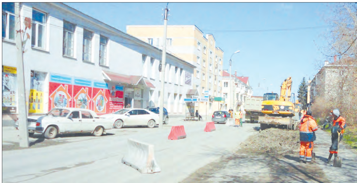
Улица Красных Героев ждала капитального ремонта несколько лет. Наконец работы начались и вскоре березовчане перестанут говорить о ней как о «фронтной»

По сообщениям Департамента информационной политики Свердловской области