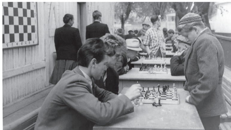
Шахматно-шашечный турнир в парке им. А.П. Бондина, 60-е годы.

А отмечать есть что. Шахматно-шашечная секция была создана в Нижнем Тагиле в 1926 году, в тяжелое время для молодой советской страны. По