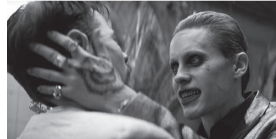
Кадр из фильма «Отряд самоубийц». Джаред Лето (справа).

Фильм «Отряд самоубийц», снятый по мотивам культовых комиксов издательства DC Comics, недавно буквально взорвал российский прокат. И пусть картину негативно оценил министр культуры Владимир Мединский, а критики отметили чересчур запутанный сюжет, в фильме есть один бесспорный плюс – хорошие актеры, сумевшие создать запоминающиеся образы суперзлодеев, получивших шанс на сокращение тюремного срока на выполнение задания правительства.