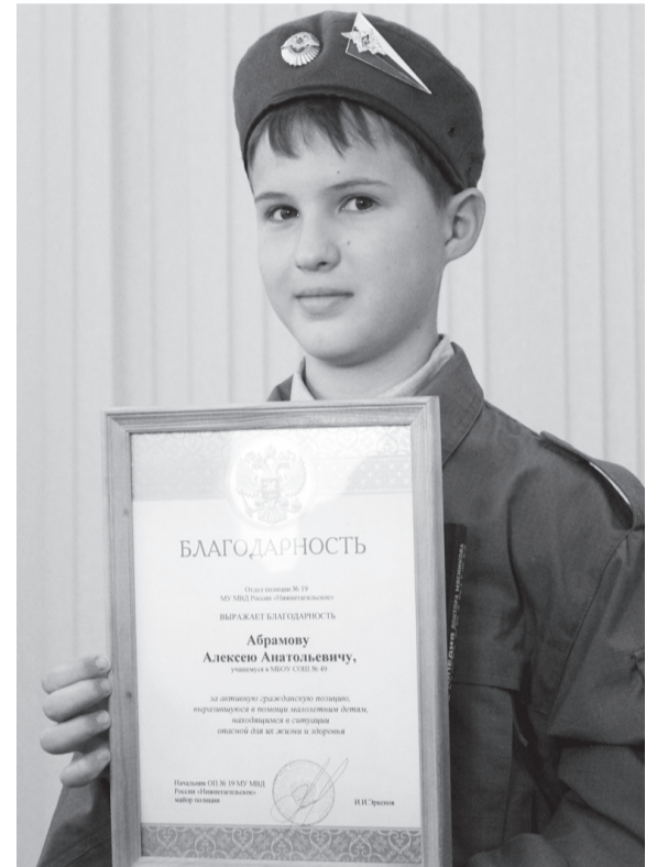
Ольга ПОЛЯКОВА.

В отношении родственников детей, оказавшихся на улице, сотрудники полиции проводят проверку, сообщили в пресс-службе МУ МВД России «Нижнетагильское». Установлено, что мама ушла на работу, оставив малышей на попечение бабушки и своего сожителя. Взрослые, позабыв о детях, стали выпивать и не заметили, как те вышли из квартиры.