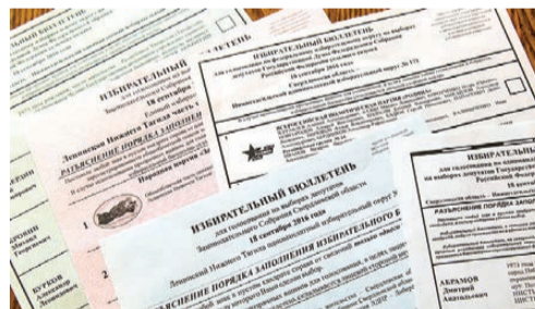
Такие бюллетени получит каждый избиратель.

Опускать бюллетени с отметкой за определенную партию и кандидата (без какой-либо отметки бюллетень будет считаться недействительным) мы будем в прозрачные ящики. Они уже установлены на 157 избирательных участках нашего города. Кроме того, на 110 – подключены КОИБы – комплексы обработки избирательных бюллетеней.