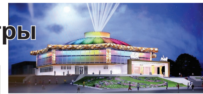
Кадр презентации: чем не дворец?

для здания тагильского цирка – дорогой и уникальный, можно сказать, единственный в России, так как в точности воспроизвести и повторить игру света невозможно. При этом он работал над ним совершенно бесплатно. Художественное освещение цирка передает праздничное настроение через многоцветную палитру и возможность прибором менять цветовой спектр на более чем 16 млн. цветов. Основной объем света сосредоточится на куполе и шатре здания. Краски меняются в такт музыке. Цвет и музыка будут следовать друг за другом. Днем здание будет напоминать переливами северное сияние. А вечером преобразится до сказочного дворца с фонтаном ярких лучей над куполом. Музыка будет играть перед началом представлений, несколько раз в день. Видеопрезентация уникального проекта можно посмотреть на сайте «ТР»: www.tagilka.ru. Внутри цирк тоже преобразится. Серые стены старого фойе превратятся в картинки,