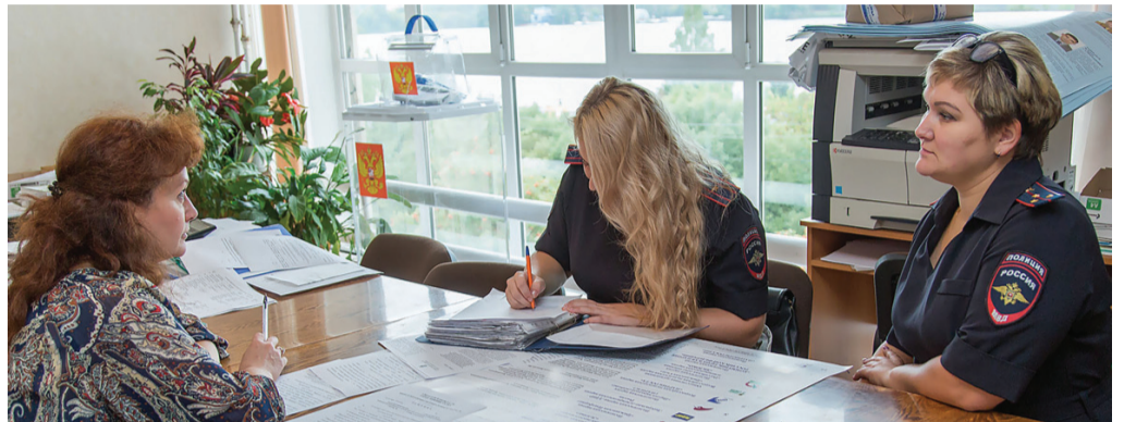
Сотрудники избиркомов перешли на усиленный режим работы.

Важно: в Государственную думу попадут те партии, которые преодолеют проходной барьер. Для этого им надо набрать минимум пять процентов голосов избирателей. Так что каждый голос – не для «галочки».