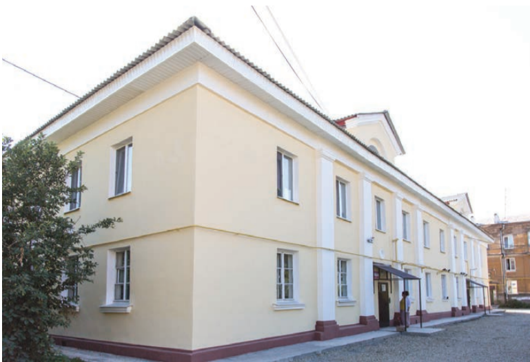
Дом №21 на Липовом тракте после капремонта.