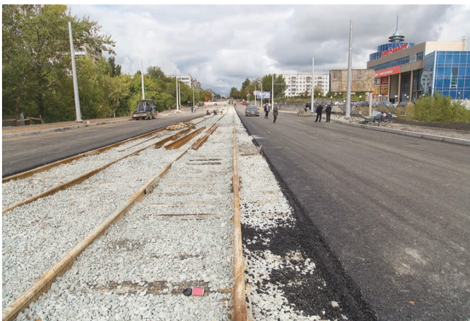
Трамвайные рельсы уже уложены.

Наталья НИКОЛАЕВА.