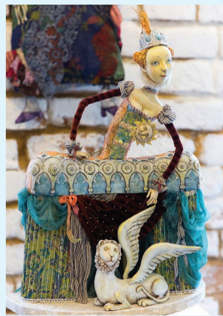
«Венеция» Светланы Резановой.