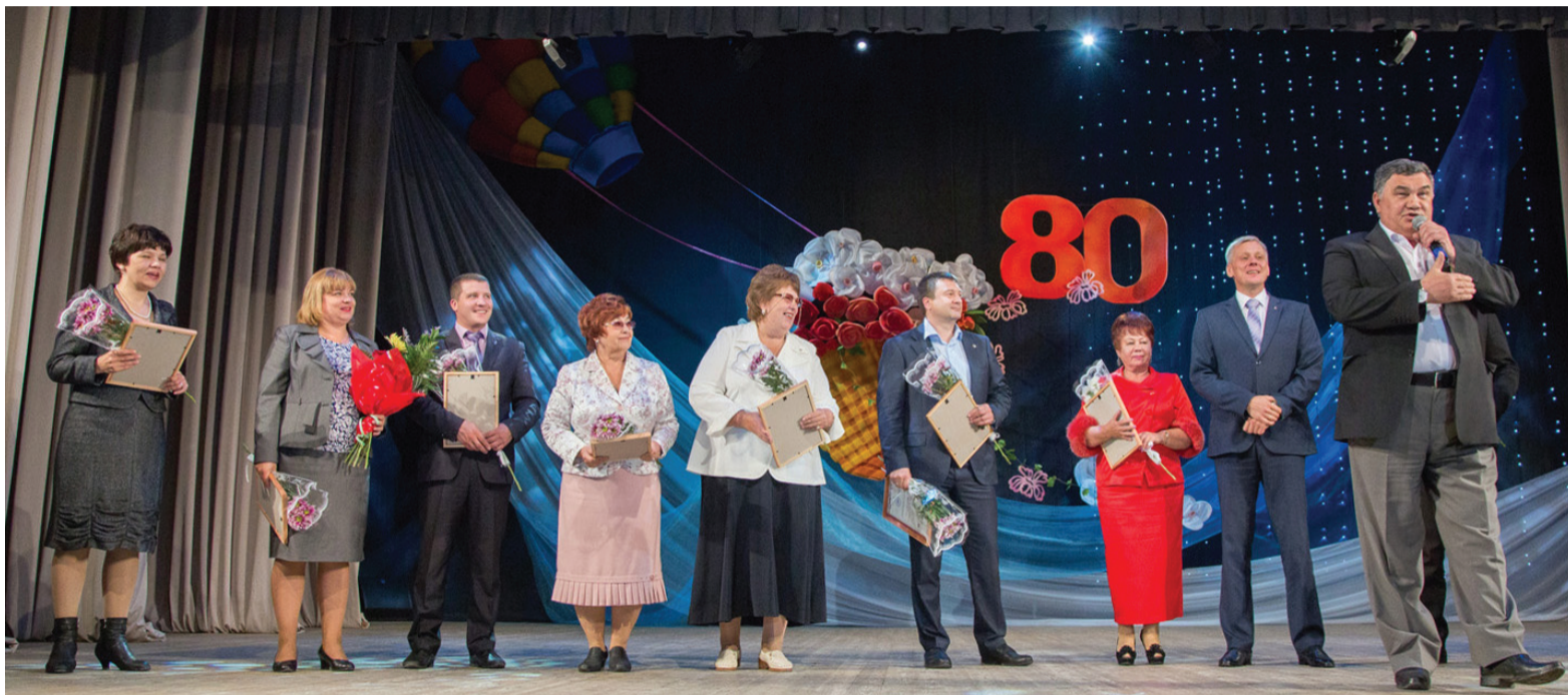
На сцене – руководители предприятий и организаций Ленинского района.

В Ленинском районе сосредоточены уникальные исторические и культурные ценности, ставшие символами Нижнего Тагила