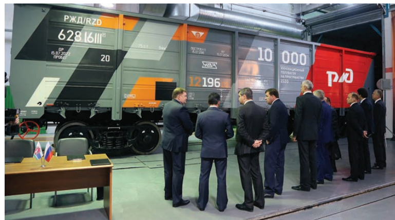
Юбилейный 10-тысячный полувагон.

Еще больше фотографий смотрите на сайте www.tagilka.ru .