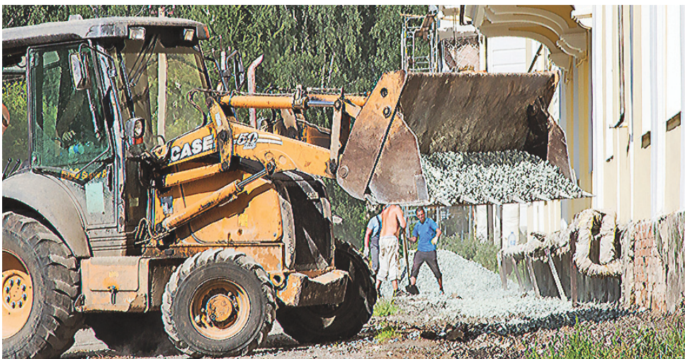
Ремонт отмостки в домах на улице Кутузова.