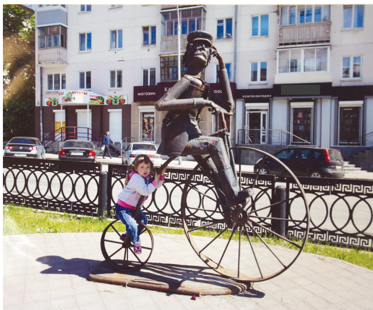
«Прокати меня, Петруша». Автор – Леонид Недопекин.

Особая категория работ – загадки. Фотографы сняли всем