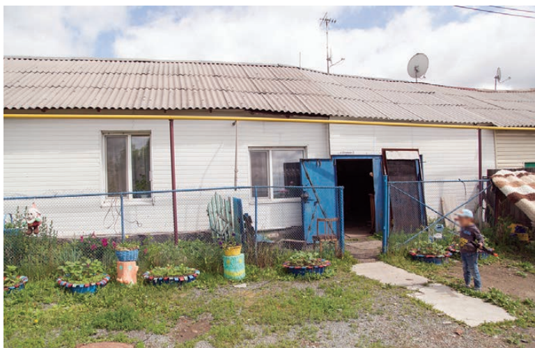
Здесь живет злая собака.