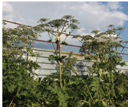
Борщевик остался только по периметру автостоянки.