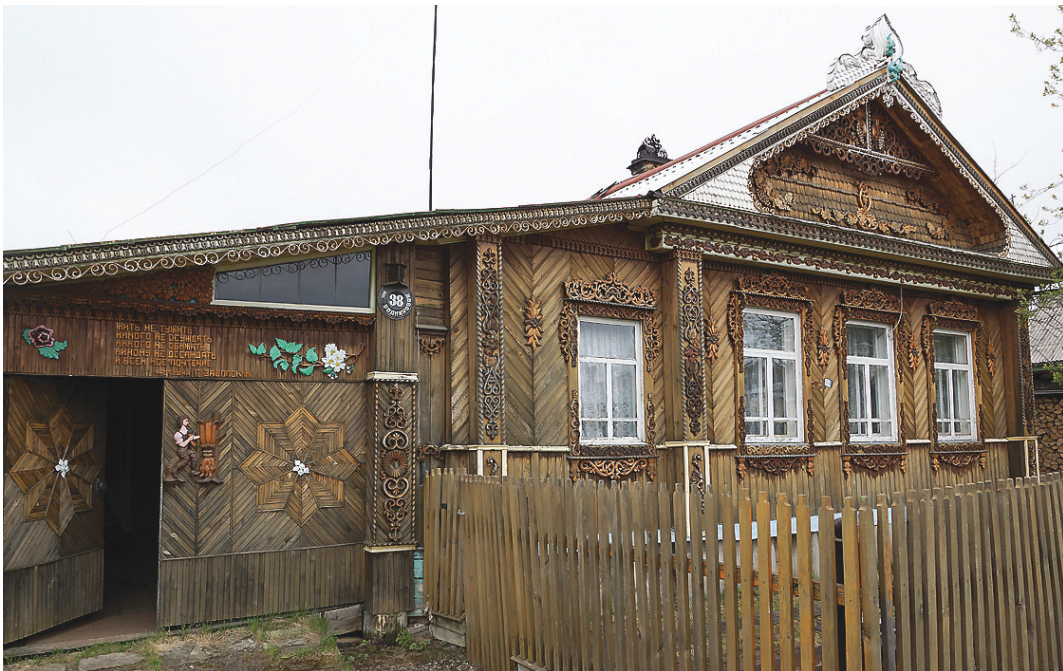
Дом Тамбовцева – произведение искусства.