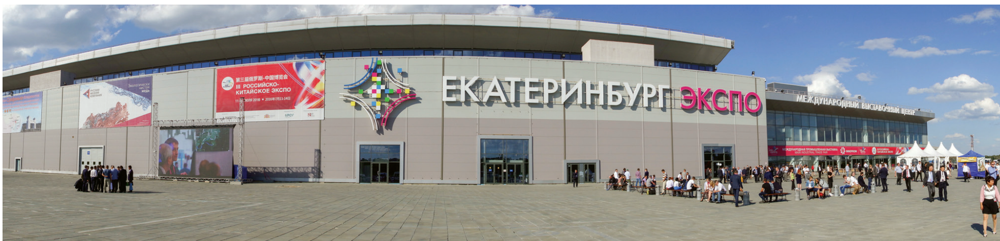
Выставочная площадь комплекса составляет 50 тыс. кв. метров.

Мэр Сергей Носов коротко познакомил потенциальных инвесторов с почти 300-летней историей Нижнего Тагила и подробно рассказал об огромном экономическом потенциале территории. Площадка в районе Сухожского поселка, между Дзержинским и Ленинским районами, - перспективная база для создания производств легкой промышленности и товаров народного потребления. Торговых центров в городе уже достаточно, а промышленное производство обеспечит новые рабочие места. Индустриальная площадка может стать филиалом «Титановой долины».