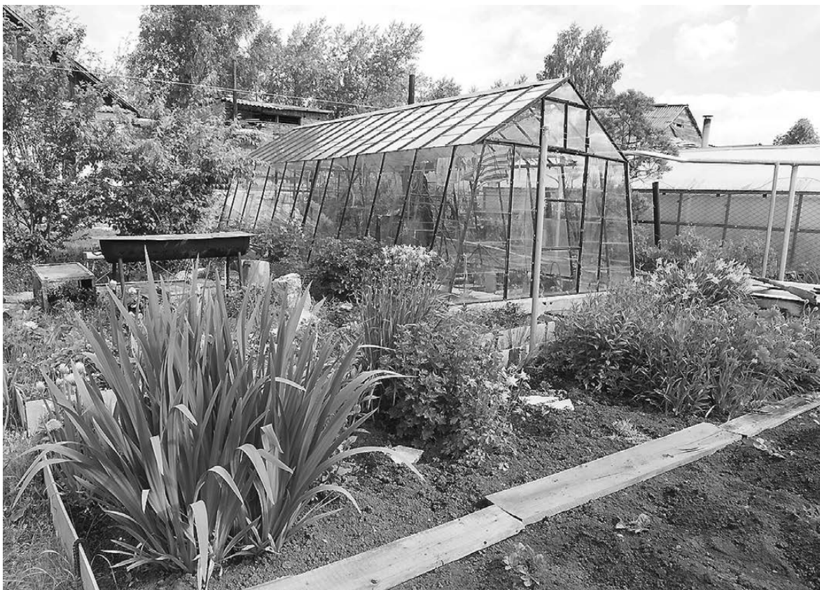
Уголок для отдыха, теплица, цветник - компактно и удобно.

Освещенность участка тоже поможет грамотно расположить строения, а также определить правильное местоположение для посадки растений. Оценить ее можно в интернете, воспользовавшись картами Яндекс или Google: там можно увидеть подробное движение солнца конкретно по вашему участку.