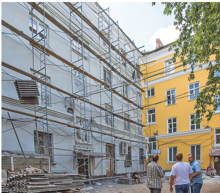
Ремонтируют дом на улице Metallургов, 14.

– Горячий телефон мы организовали, исходя из опыта прошлогодней кампании, когда связь с жителями была по-