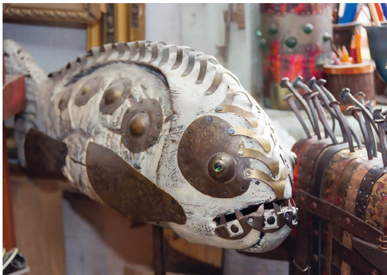
Диковинные вещицы мастера.