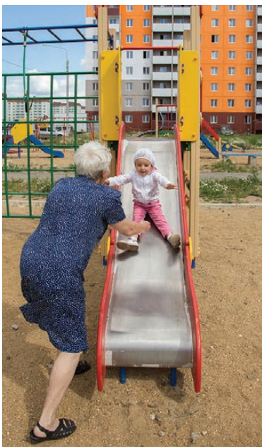
Детская площадка пользуется большой популярностью.

Мест для парковки достаточно, а вот зеленая зона будет первой