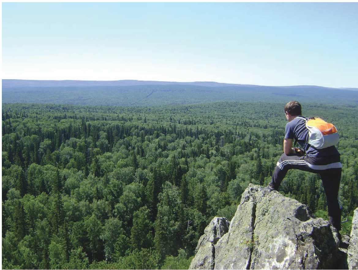
На вершине горы Баклушина.

Вершина оказалась очень интересной и абсолютно дикой. Поросшие лишайником скалы и курумник – этакая каменная «река» перед ними. Со скал открывается чудесный вид на лес и горы, вдалеке виднеются Нижний Тагил и Верхне-Выйский