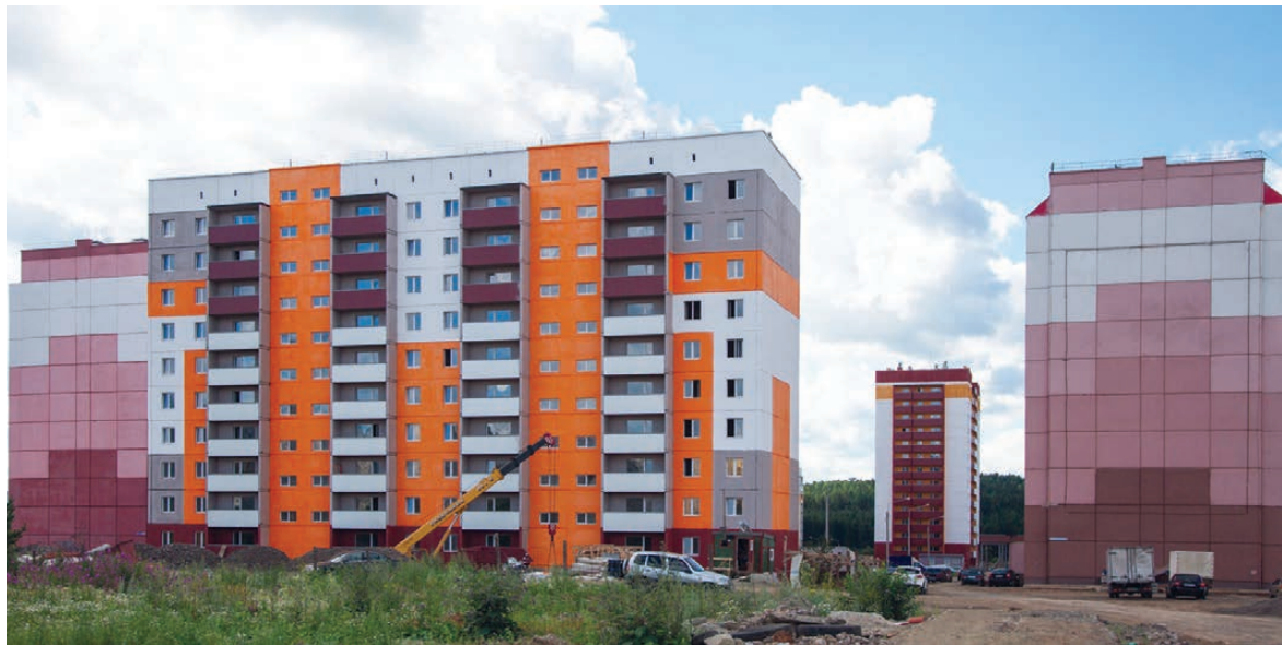
Дома, построенные «Трестом Магнитострой».

Встреча началась с самой актуальной темы: состояния подъездных путей. Добраться до «Муринских прудов» на машине можно, хотя после дождей здесь очень грязно, а вот пешком – сложно и в сухую погоду.