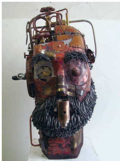
«Тревожные сны сантехника Василия».