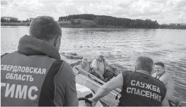
Инспекторы проверяют документы у судовладельца.

По мнению спасателей, реанимация оказалась эффективной, потому что мужчина не наглотался большого количества воды, так как потерял сознание из-за приступа эпилепсии.