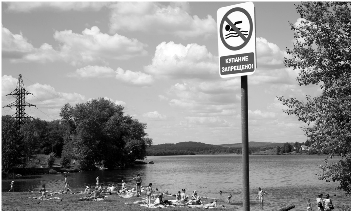
Пляж на Выйском пруду.

- Я рядом живу, поэтому, можно сказать, выросла на Выйском пруду. Когда работал ВМЗ, здесь было замечательно: туалет, кабинки для переодевания, питьевой фонтанчик, дежурили спасатели, рядом располагалась лодочная станция. Еще осталось немного завезенного в то время песка. Теперь, конечно, все не так. Но в этом году видно, что за территорией ухаживают, вовремя косят траву, прибирают. Если бы сами отдыхающие поменьше оставляли мусора, вообще были бы чистота и красота.