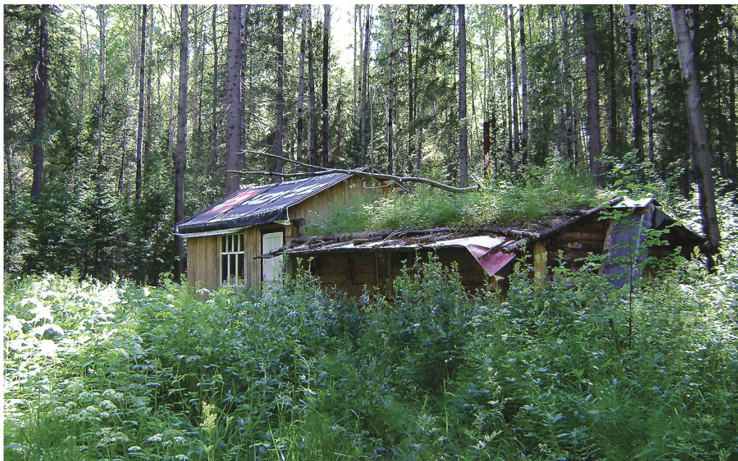
Лесной «дом холостяка».