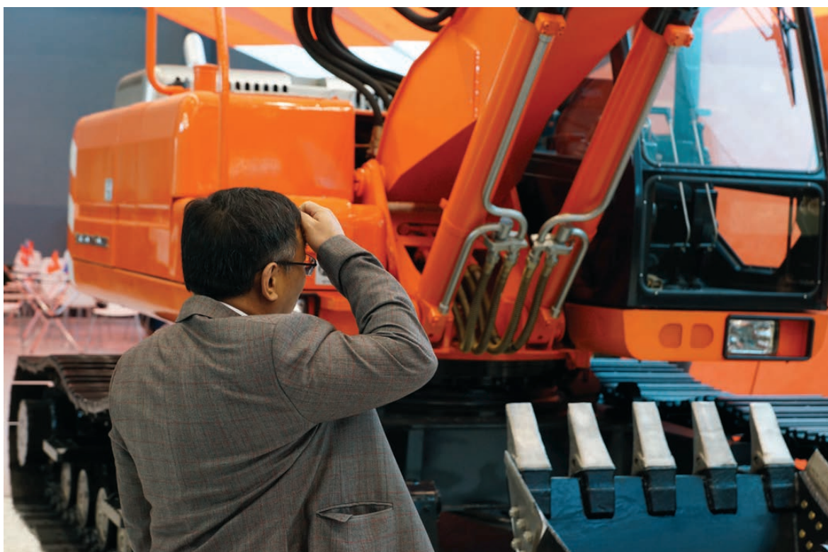
Экскаватор УВЗ привлек внимание потенциальных покупателей.

рии. С ним также связывается повышение туристической привлекательности Нижнего Тагила и Свердловской области.