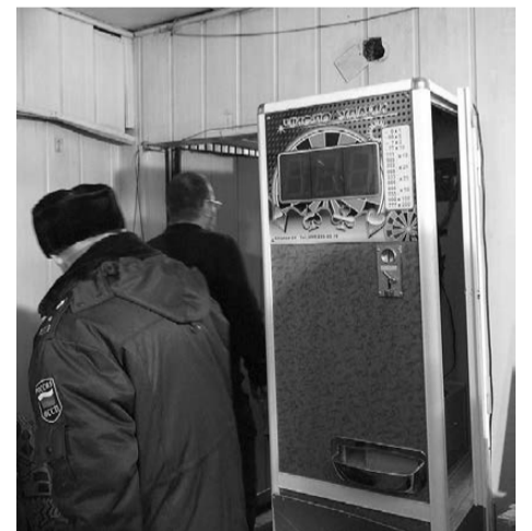
Выселение проходило при поддержке полиции.