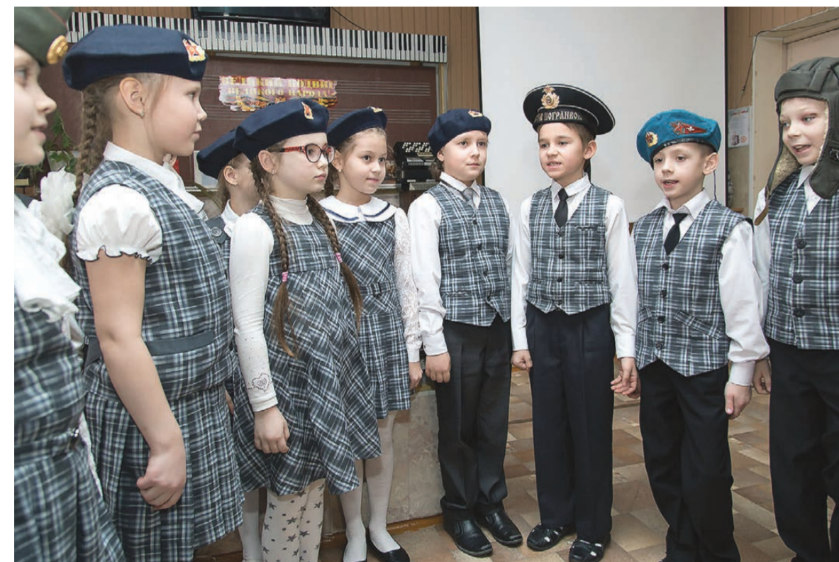
Именинницу поздравляют юнармейцы 2-го «А» класса.

Татьяна ШАРЫГИНА.