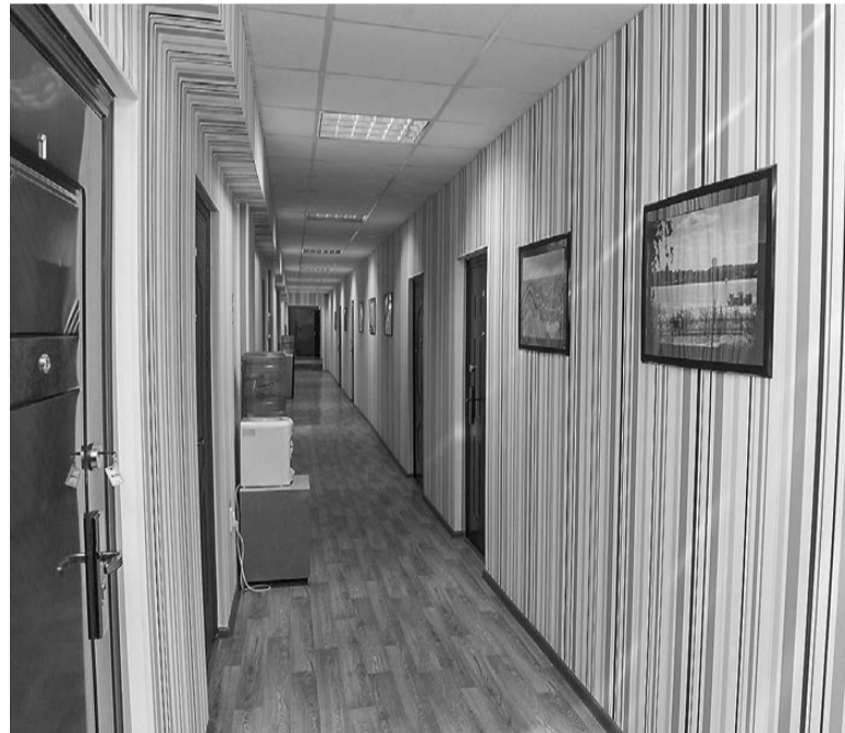
Главный коридор гостиницы.

Татьяна ШАРЫГИНА.