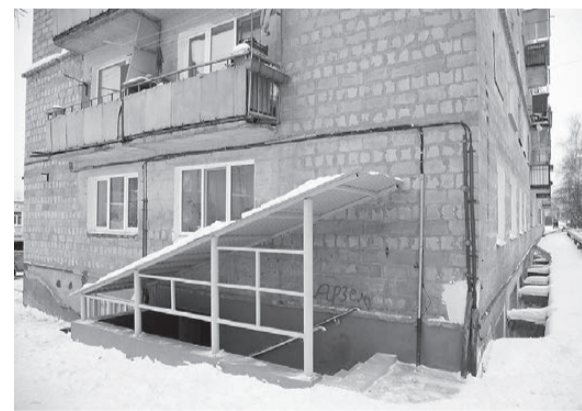
Опорный пункт полиции №19.

Татьяна ШАРЫГИНА.