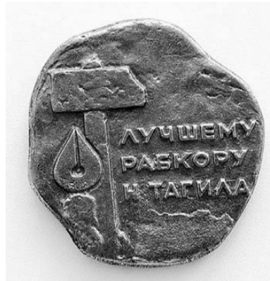
Так выглядела престижная медаль имени Быкова, получить которую было честью для любого тагильского рабкора.

Подготовила Людмила ПОГОДИНА.