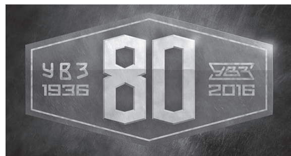
Эмблема символизирует преемственность поколений.

Летом тагильчан ждет большой концерт с праздничным салютом на центральной площади