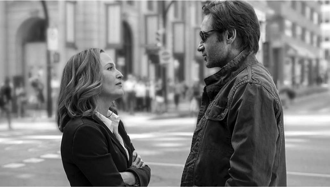
Джиллиан Андерсон (агент Скалли) и Дэвид Духовны (агент Малдер).