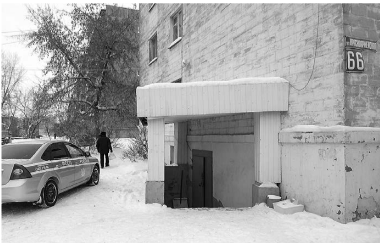
Подвал на Красноармейской, 66, расположен в центре города.