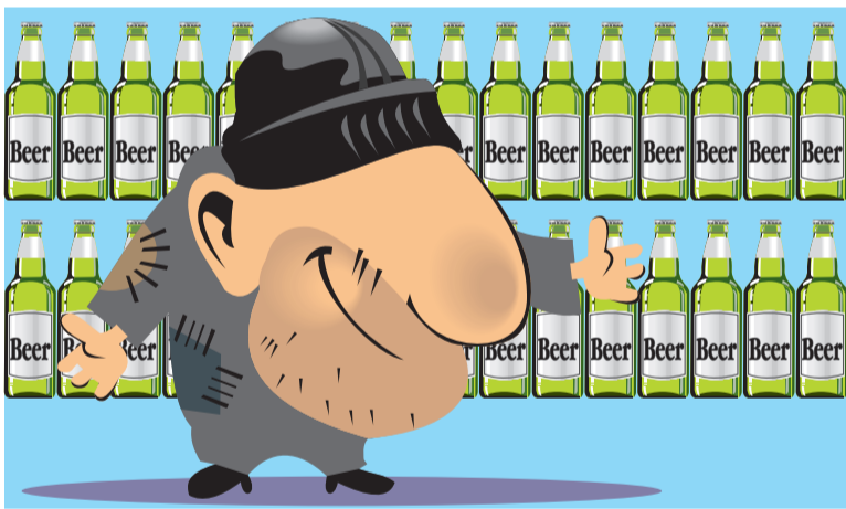
ИЛЛУСТРАЦИЯ ПЕТРА УПОРОВА.

Ночью, дождавшись, пока охранники разойдутся по домам, бомж отправился в торговый зал тамбовского центра «Европа», где запасся дорогим коньяком, пивом и шоколадом. Припасы он отнес на цокольный этаж, где расположен мебельный салон. Там мужчина на представленных в торговом зале предметах мебели и употребил спиртное. Он еще несколько раз за ночь ходил за продуктами, а под утро вновь спрятался в туалете и после открытия центра беспрепятственно покинул магазин. Из-за перемещений бездомного сработали датчики движения, однако охранник, находившийся на дежурстве, их проигнорировал. Он объяснил это тем, что они нередко включаются из-за падающих с полок товаров. Пир бомжа засекли камеры видеонаблюдения. Руководство «Европы», тем не менее, решило оставить его поступок безнаказанным и не стало обращаться в полицию, поскольку мужчине нечем возместить причиненный ущерб.