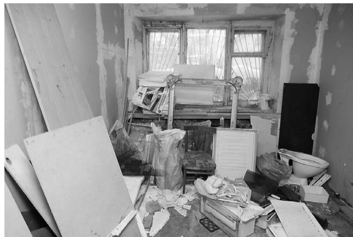
Вот такой «порядок» во всех помещениях подвала.