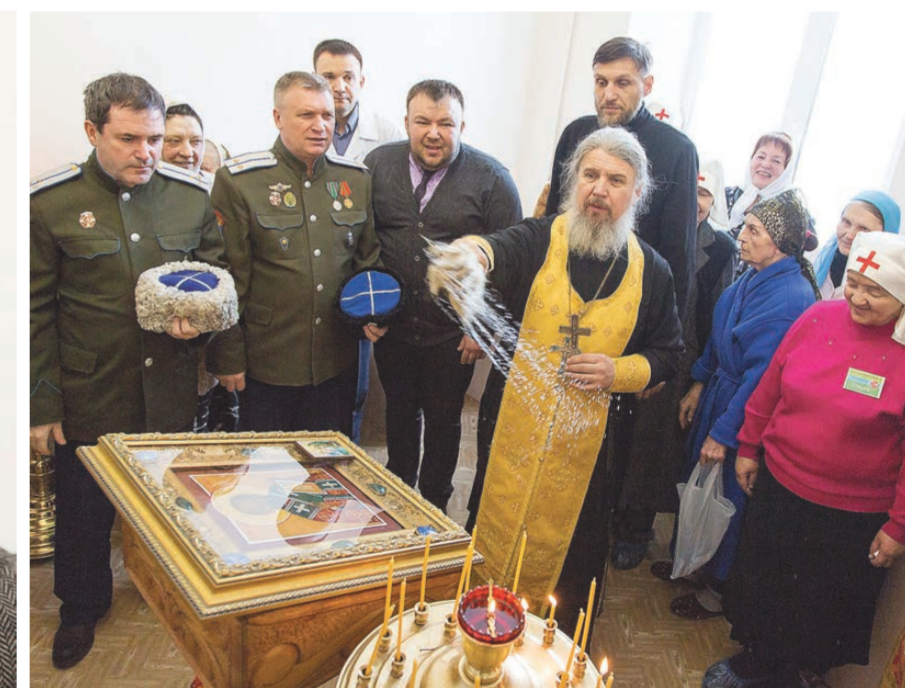
Первый молебен в новом помещении больничного храма.

Православный домовый храм во имя святителя Николая Чудотворца и святого великомученика целителя Пантелеймона открыт в городской Демидовской больнице. Небольшая комната с иконостасом уютна, создает ощущение теплоты и умиротворенности.