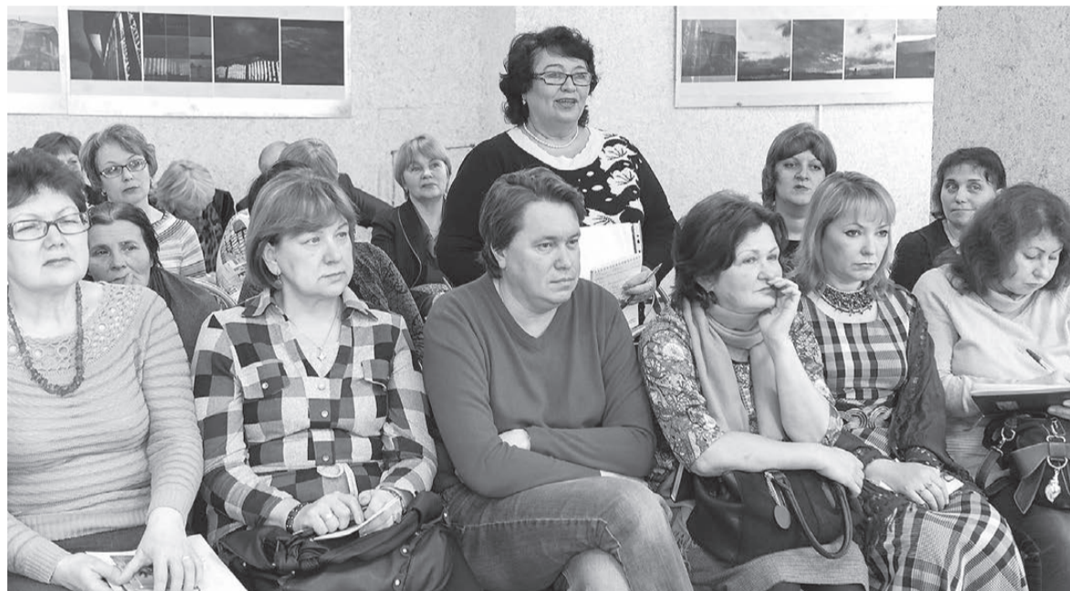
В зале библиотеки собрались лидеры профсоюзных организаций учреждений культуры.

один», очень важно, по словам главы города, уметь находить компромиссы, искать правильное решение.