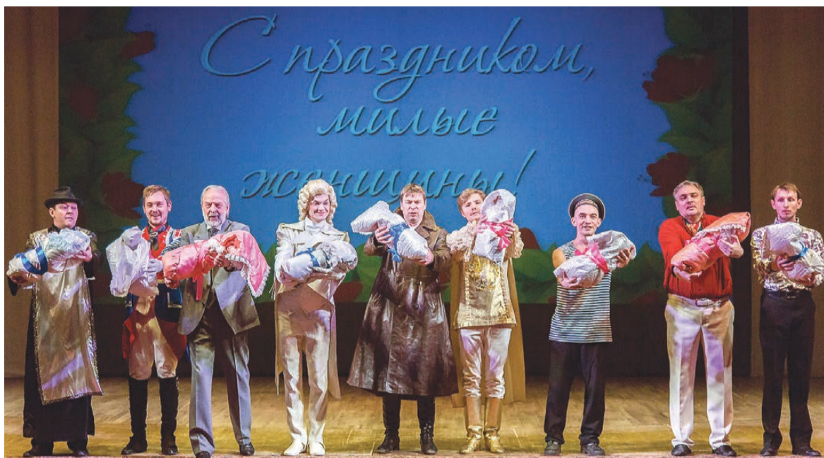
Творческий номер от актеров драматического театра.