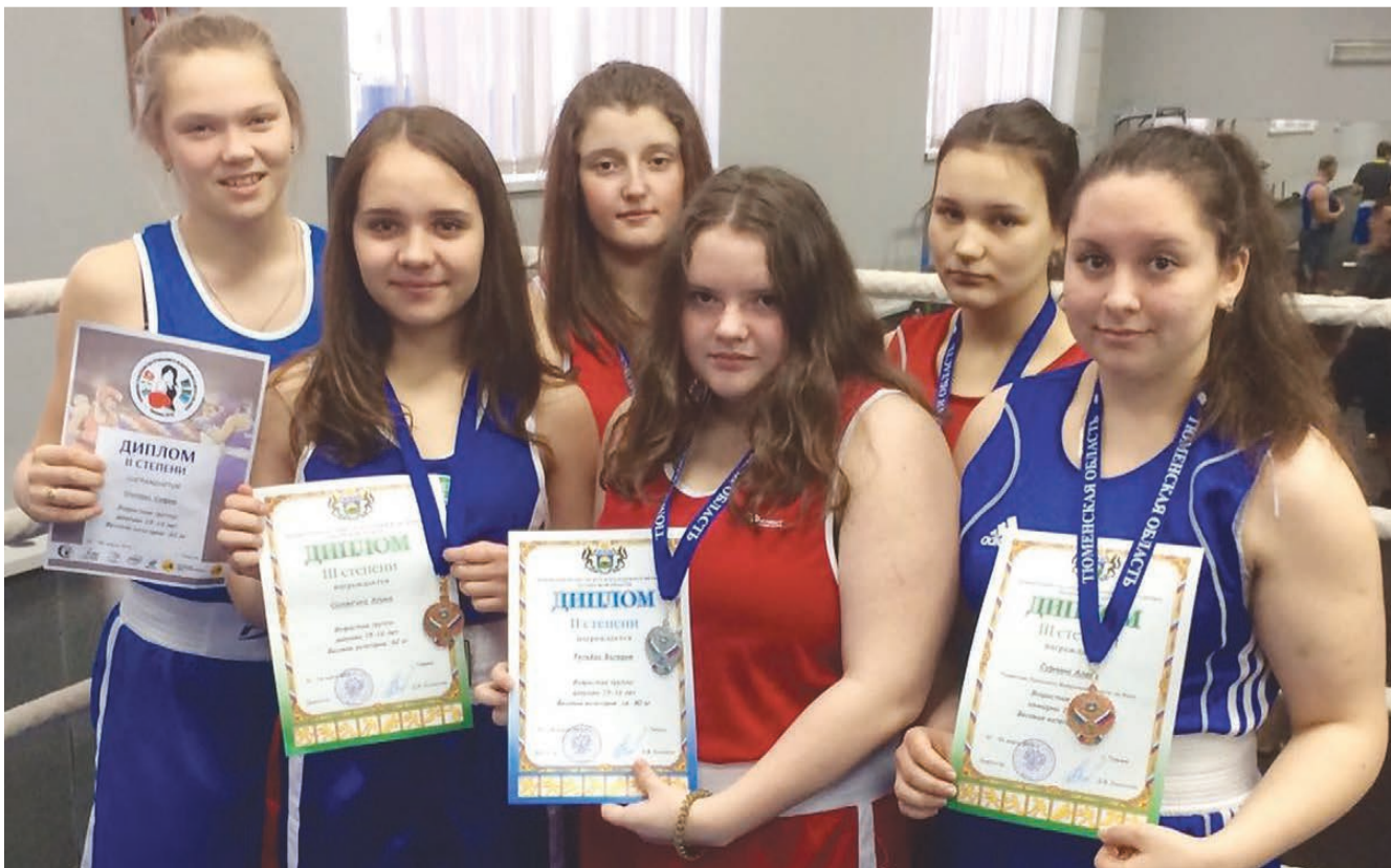
Сборная девушек СДЮСШОР «Спутник».