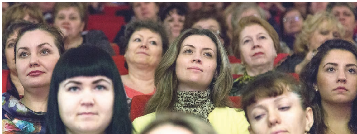
В системе образования Нижнего Тагила трудятся более десяти тысяч женщин.