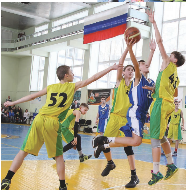
«Соболя» отражают атаку екатеринбуржцев в заключительном матче.

нужно было побеждать обязательно. Иначе - третье место, а в финал выходят первые две команды из шести.