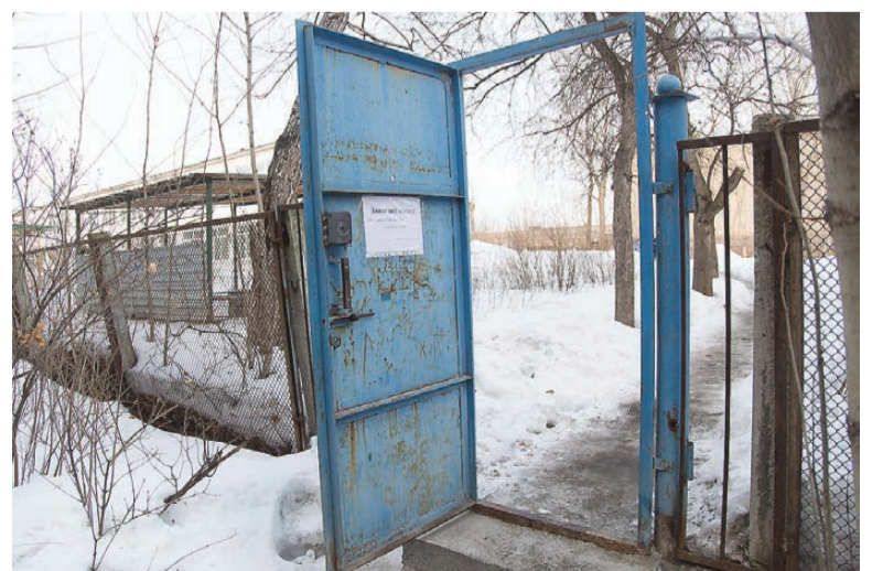
Камень преткновения – новая калитка.

Татьяна ШАРЫГИНА.