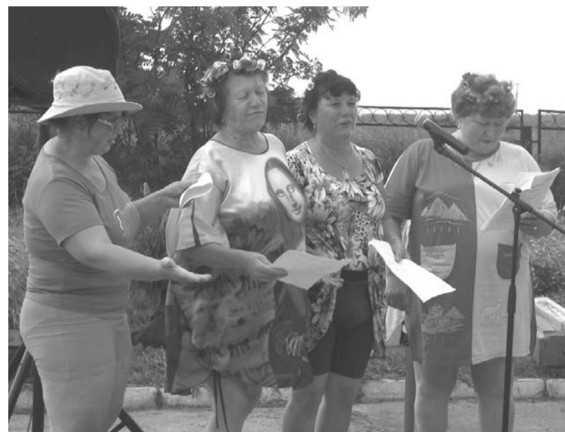
Команда сельчан "Семейные трусы"

Праздничным концертом, чаепитием, дискотечкой и фейерверком отметили 240-летие села жители Акинфиево