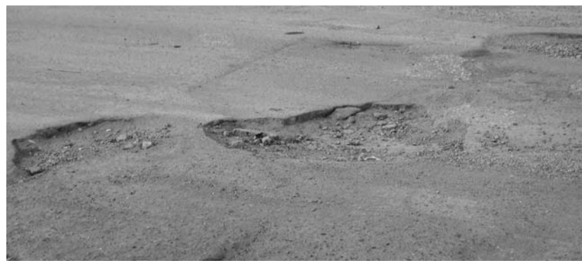
Дорога у заводууправления НСМЗ