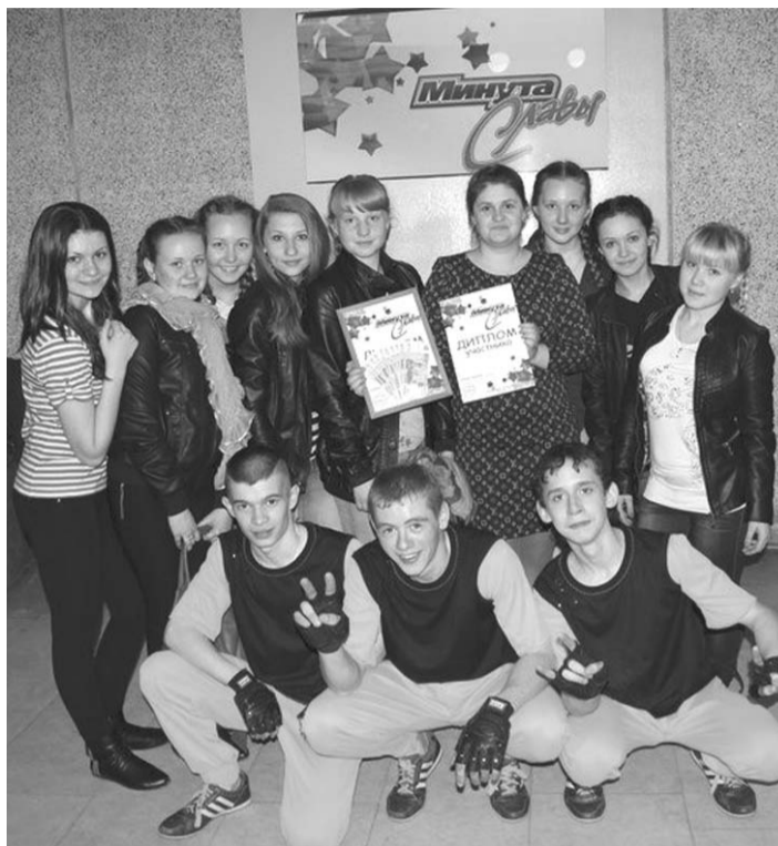
Победители шоу "Минута славы" - танцгруппа "Infinity"

Девятнадцать конкурсантов в возрасте от 8 до 60 лет продемонстрировали свои таланты на шоу «Минута славы». Мероприятие прошло 4 мая на сцене городского Дворца культуры Нижней Салды.