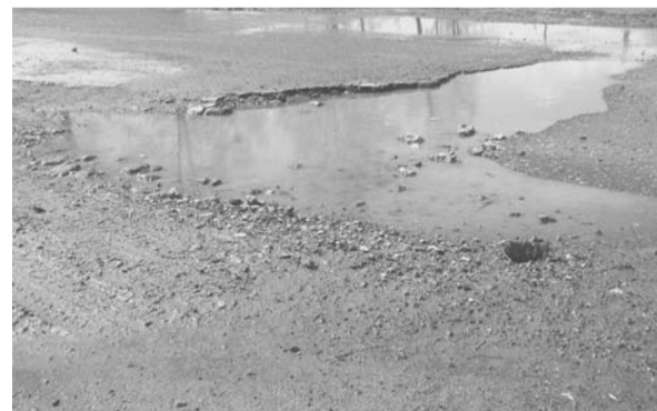
г. Н.Салда, перекресток улиц П.Коммуны и Терешковой