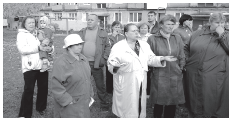
Встреча жильцов квартала «А» с коммунальщиками

И опять понеслось: перед домом каждый год копают, асфальт для машин делают, а для нас, пешеходов, - ничего. В лучшем случае щебень бросят, по нему идешь – ноги подворачиваются, а с колесками и вовсе не пройти. Сделали трубу для воды, а стока нет. Вода в канаве стоит, уже камыши растут! Весной