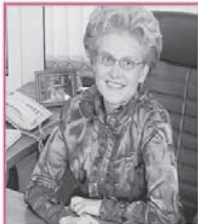
Фото телеведущей Елены Малышевой

Знаменитая телеведущая Елена Малышева в интервью корреспонденту рубрики «Здоровье» газеты «Аргументы и факты» дала свою оценку продукции Бийского предприятия «Дары Алтая», а конкретно его фирменному продукту - маслу на крови рогов марала «Пантовитол».