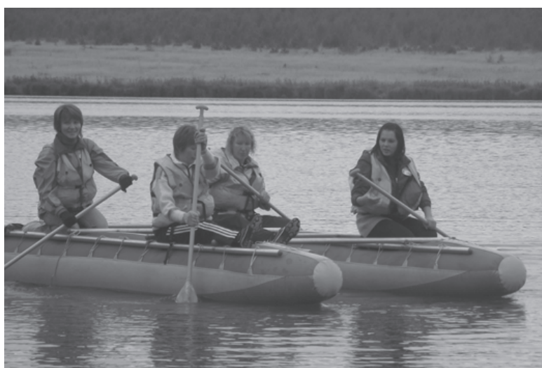
Девушки из лаборатории дали фору многим мужчинам