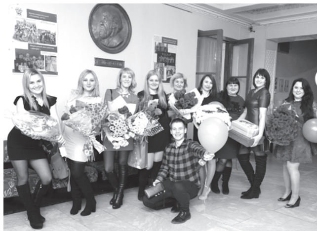
Поклонники и друзья группы «НА-НА», Friends club Na-Na, приехали из Екатеринбурга