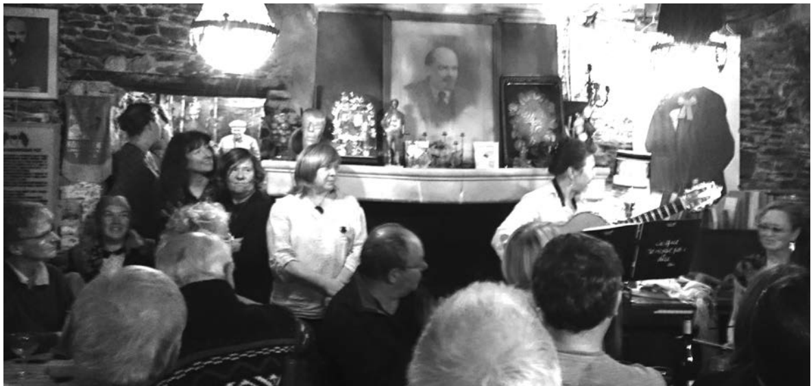
В Ленин-кафе во Франции всегда посетители