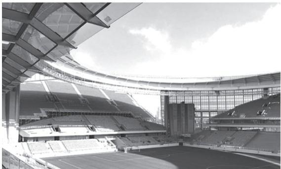
Екатеринбург, стадион, вид изнутри