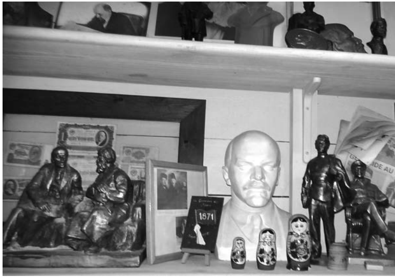
Маленький музей Ленина в маленьком Ленин-кафе, Франция

Само кафе небольшое, тесное, но повсюду звезды, плакаты Советской эпохи, красный кумач (даже в туалете