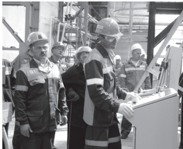
Пуск нового производства

Еще несколько лет назад работники Нижнесалдинского металлургического завода были обеспокоены тем, что ЕВРАЗ перенесет производство на НТМК, а салдинский завод закроют, однако реализация такого значимого проекта дала надежду заводчанам на стабильное будущее.