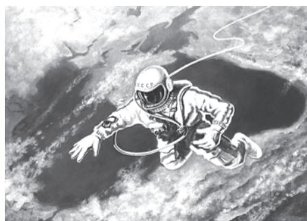
"Пролетая над Черным морем". Рисунок Алексея Леонова