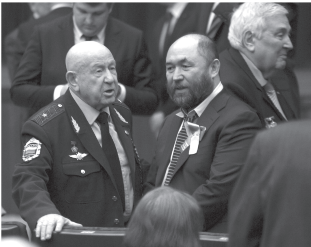
Алексей Леонов с режиссером фильма "Время первых" Тимуром Бекмамбетовым