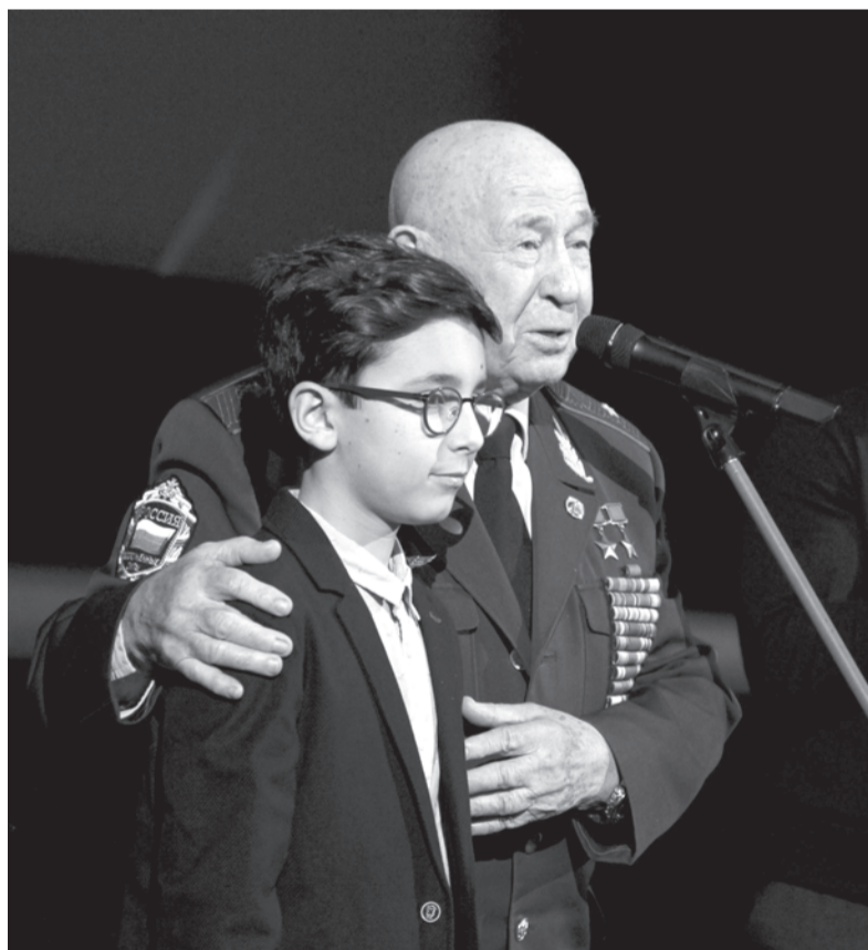
Алексей Леонов с внуком космонавта Павла Беляева