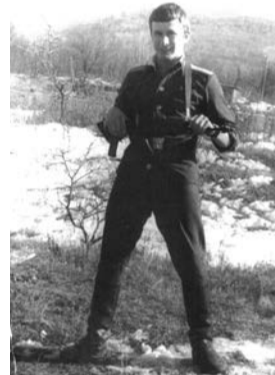
В армии. 1972 год