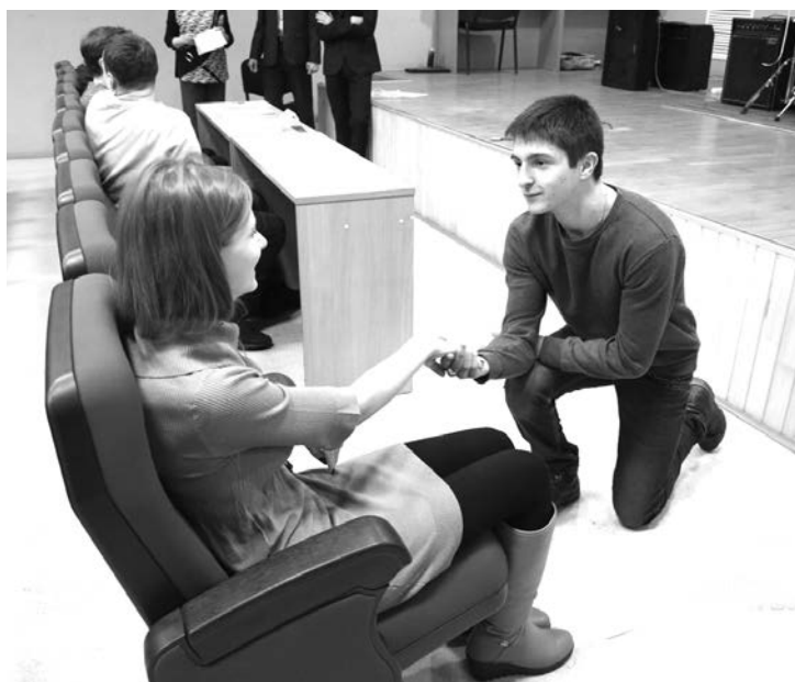
Всё решено — я в Вашей воле (объяснение Онегина Татьяне)

Ангио Лайн МЕДИЦИНСКИЙ ЦЕНТР (г. Екатеринбург)