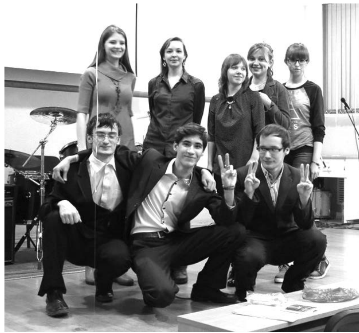
Взгляни: здесь круг твоих друзей