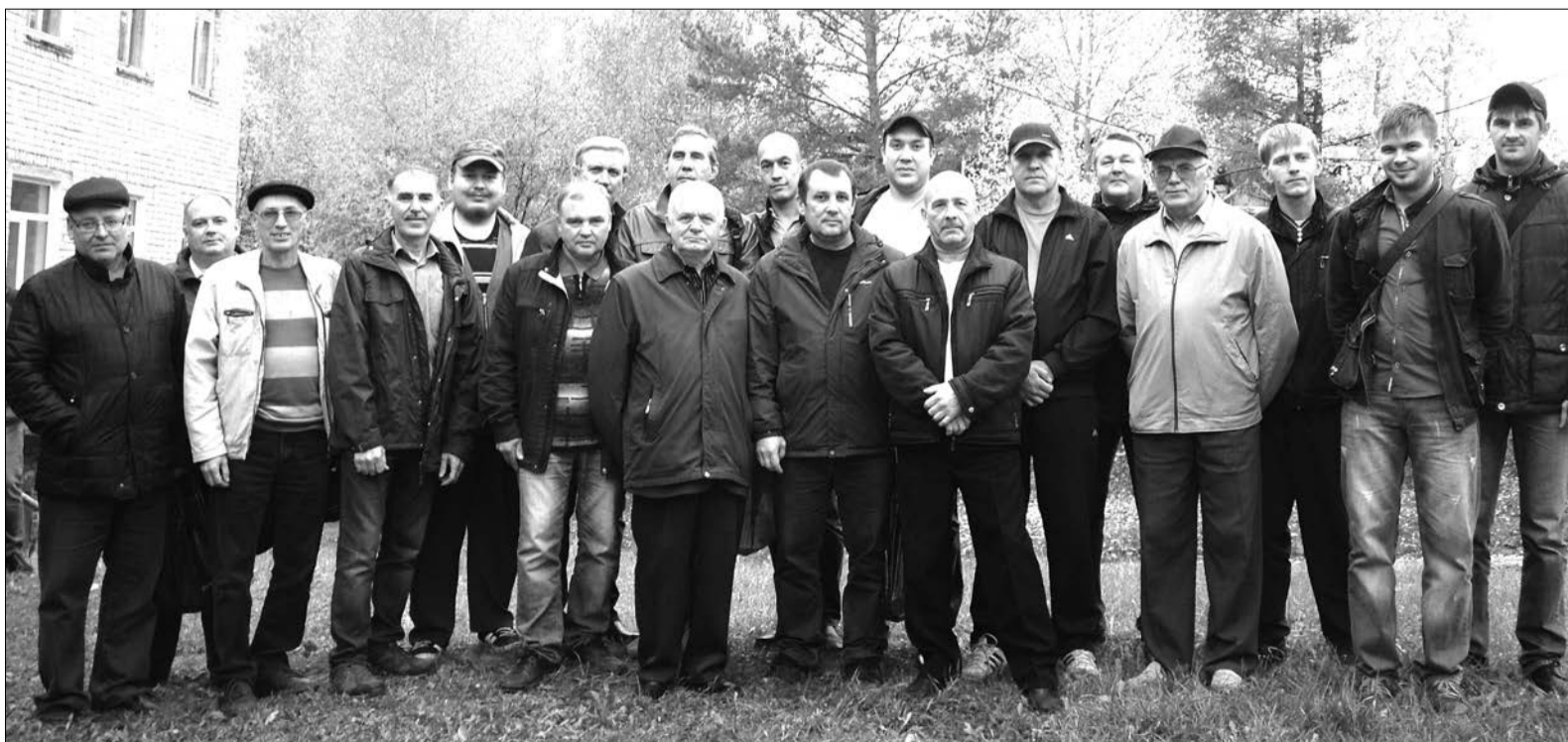
Испытатели НИК-101, 2016 г.