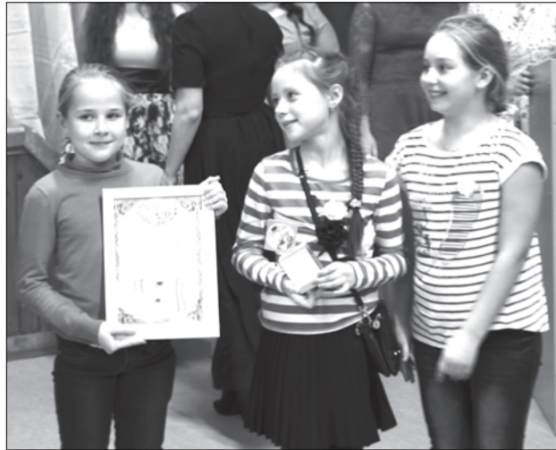
Юные кинематографисты получили Диплом "За лучший спортивный фильм"

В конце октября в верхнесалдинской школе № 6 прошла церемония закрытия школьного кинофестиваля «Золотой лисёнок»