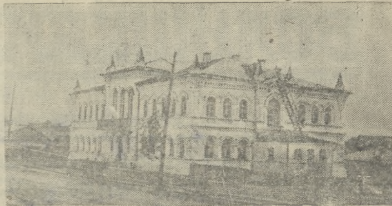
Хорошо подготовлена к новому учебному году Средняя школа № 1. Ремонт произвел шестифутовый коллектив Никелева-вода.