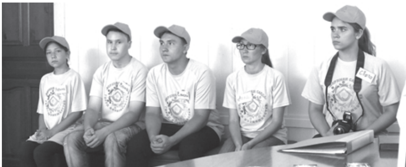
Волонтеры "Города возможностей", инициаторы круглого стола

Восемнадцатого августа в малом зале администрации Верхней Салды состоялся круглый стол «Сохранение семейных ценностей в современном мире».