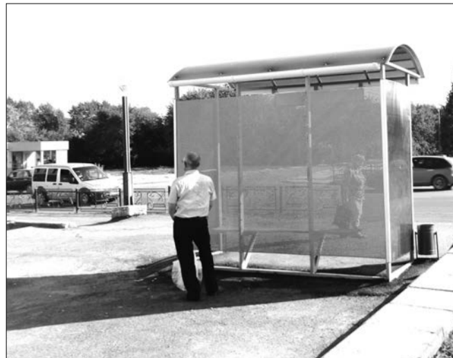
Остановка у бывшего магазина № 1. Вечер

От администрации (обоснование выбора остановочных павильонов): Остановка должна иметь крышу ... для защиты пассажиров от прямых солнечных лучей.