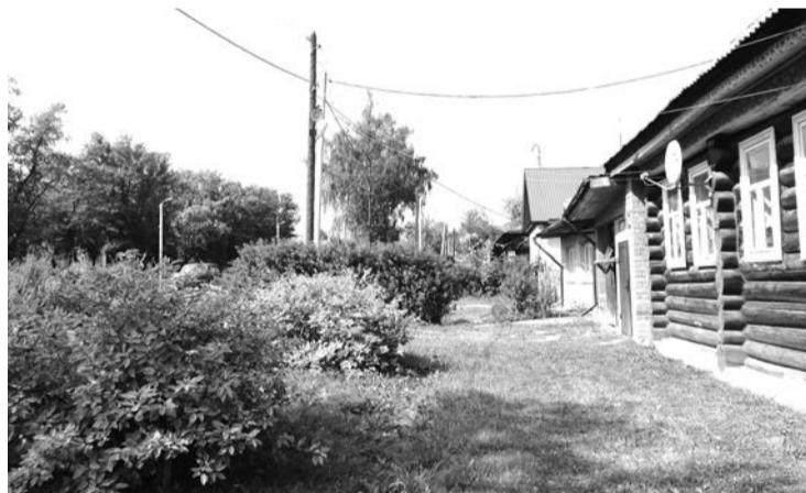
Тут и проляжет, сметая все на своем пути, тротуар

Улица Фрунзе бьет все рекорды по количеству упоминаний в нашей газете.