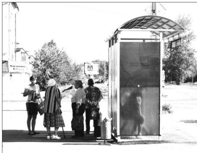
Остановка недалеко от верхнесалдинской администрации. Утро