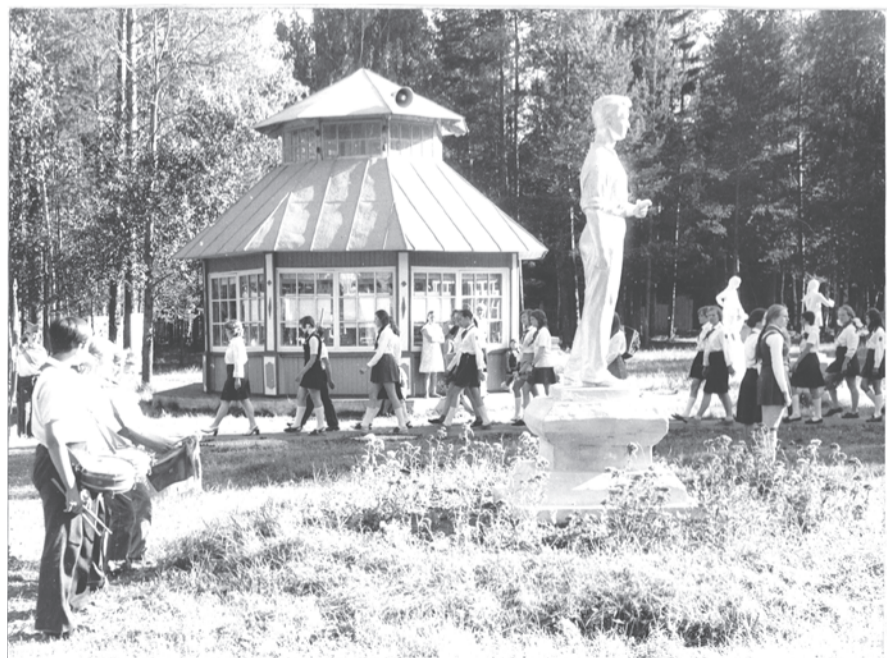
Пионерлагерь им. Павлика Морозова (Новая Иса), 70-е годы

Отряды набирались по возрасту. В первом отряде были самые старшие. Предел – окончившие 8 класс. На первой смене их обычно не было – сдавали экзамены. Второй отряд на два года моложе, 4-й отряд – бывшие перво- и второклашки, третий между ними. Построенный в 1973 году отдельный корпус занимали будущие школьники. Они считались пятым отрядом.