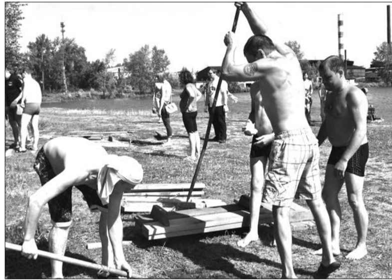
Команда отдыхающих, победившая в конкурсе

Если не поднимать задницу и оставаться на диване, то нечего рассчитывать на перемены в городе. Так что шагните с дивана если не на пляж, то хотя бы на свой двор. Подберите фантики и бутылки, отнесите их в контейнеры. Дети не должны расти в мусоре и привыкать к нему.