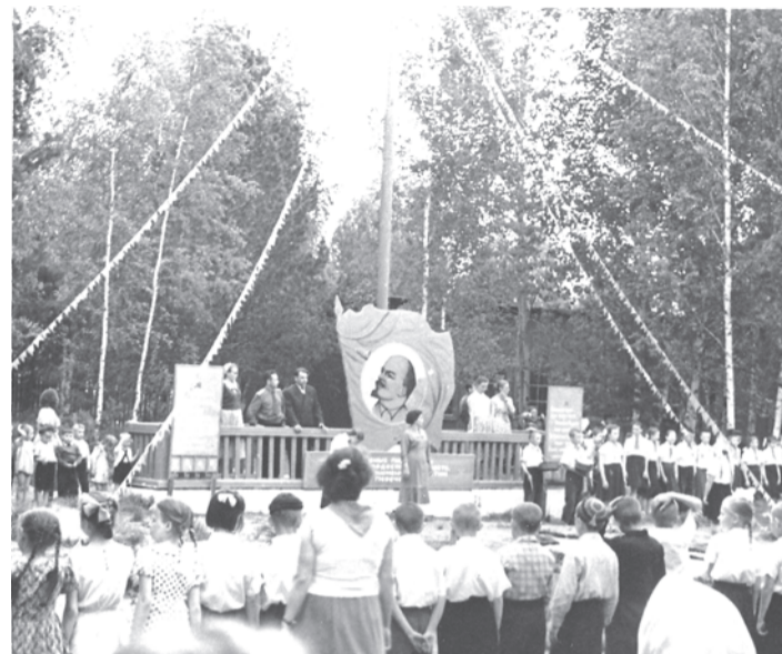
Пионерлагерь "Орленок", 60-е годы

Начинал(а) председатель совета дружины. Обычно это была либо отличница, либо очень серьёзная и ответственная девочка – будущий общественный деятель. Папанов в председателях не было никогда.