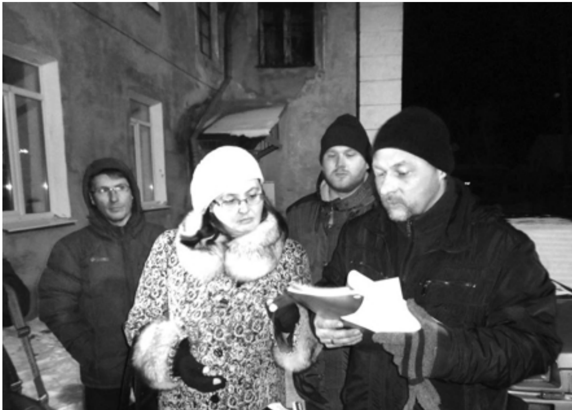
Жители зачитывают перечень необходимых дому работ