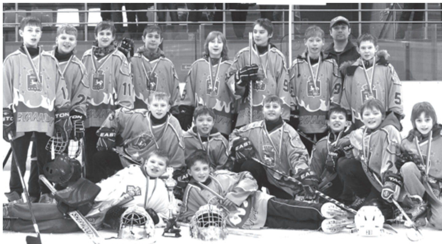
Команда «Металлург 2002-2003 г.р.».

Юные салдинские хоккеисты с 11 по 18 марта участвовали в третьем туре всероссийских соревнований на призы клуба «Золотая шайба» по Урало-Сибирскому региону, который проходил в Тобольске