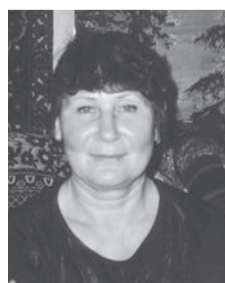
Лица. Рассказать, как удавалось ей подобрать нужные слова в нужный