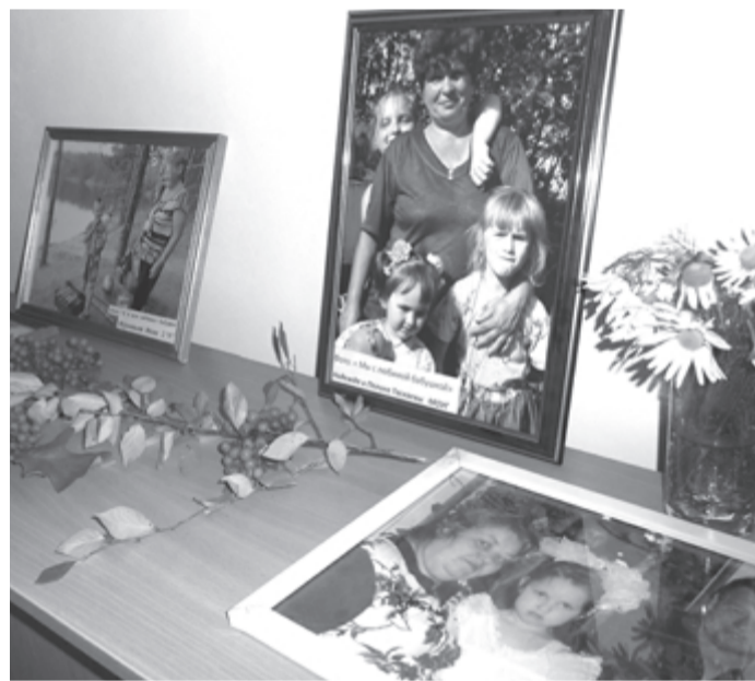
В Нижней Салде в День пожилого человека прошли концерт и выставка фотографий "Мои любимые бабушка и дедушка".