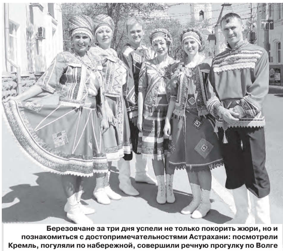
Березовчане за три дня успели не только покорить жюри, но и познакомиться с достопримечательностями Астрахани: посмотрели Кремль, погуляли по набережной, совершили речную прогулку по Волге