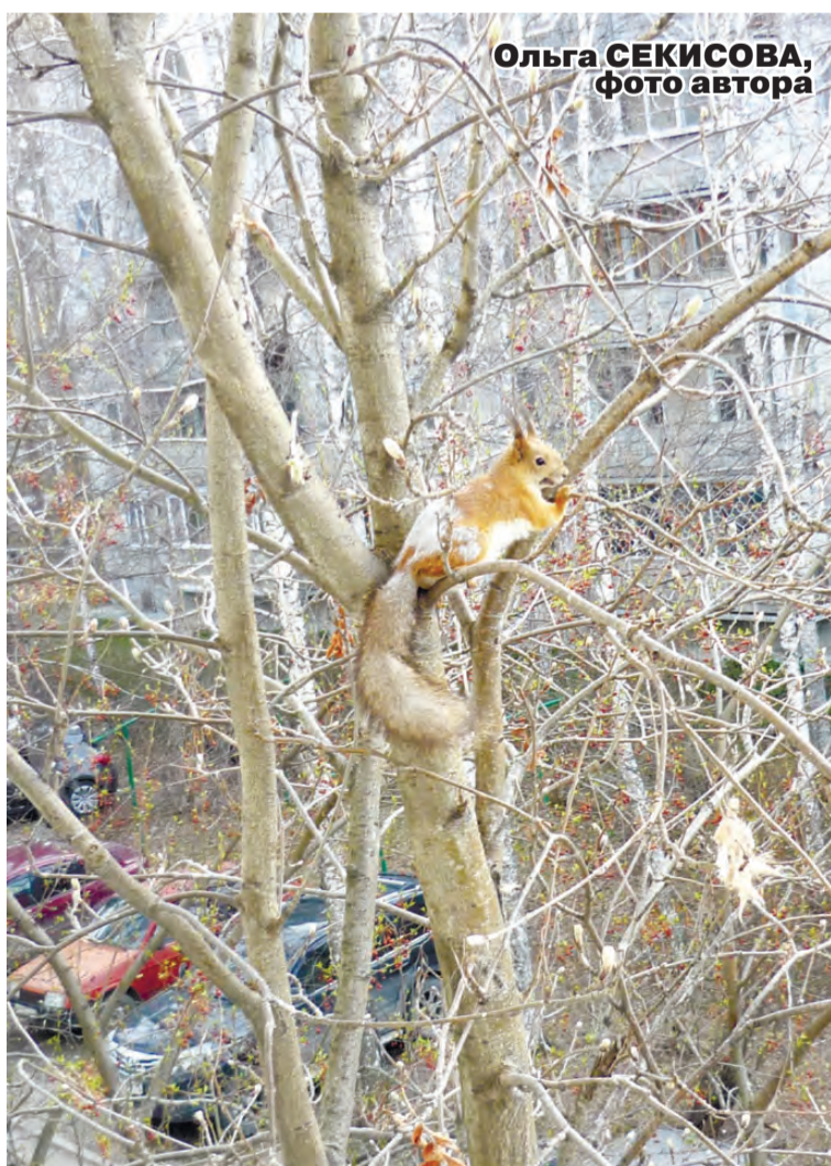
Ольга СЕКИСОВА, фото автора