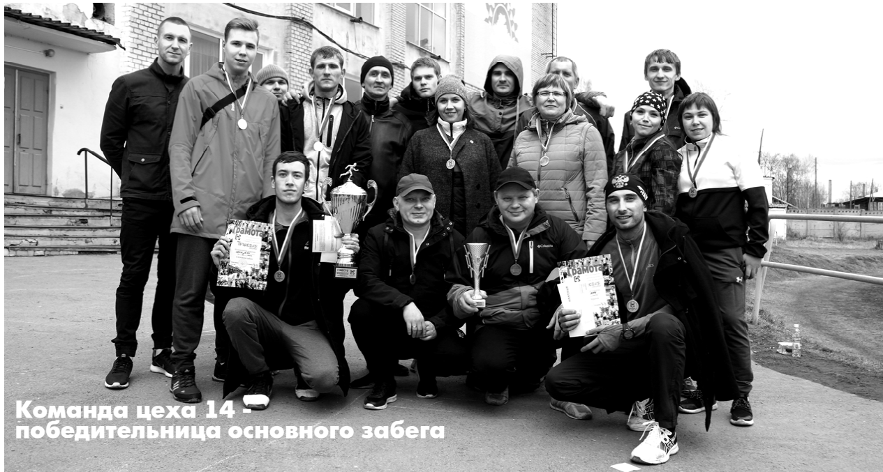
Команда цеха 14 – победительница основного забега