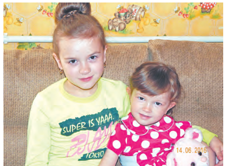
Две сестрёнки - подружки Похожи друг на дружку!

Публикуем купон, с помощью которого вы можете выбрать победителя, отправив заполненный купон к нам в редакцию.