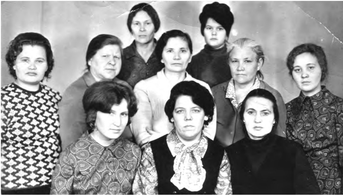
Январь 1972 г. Талицкий быткомбинат. Бригада № 1 швейного цеха.