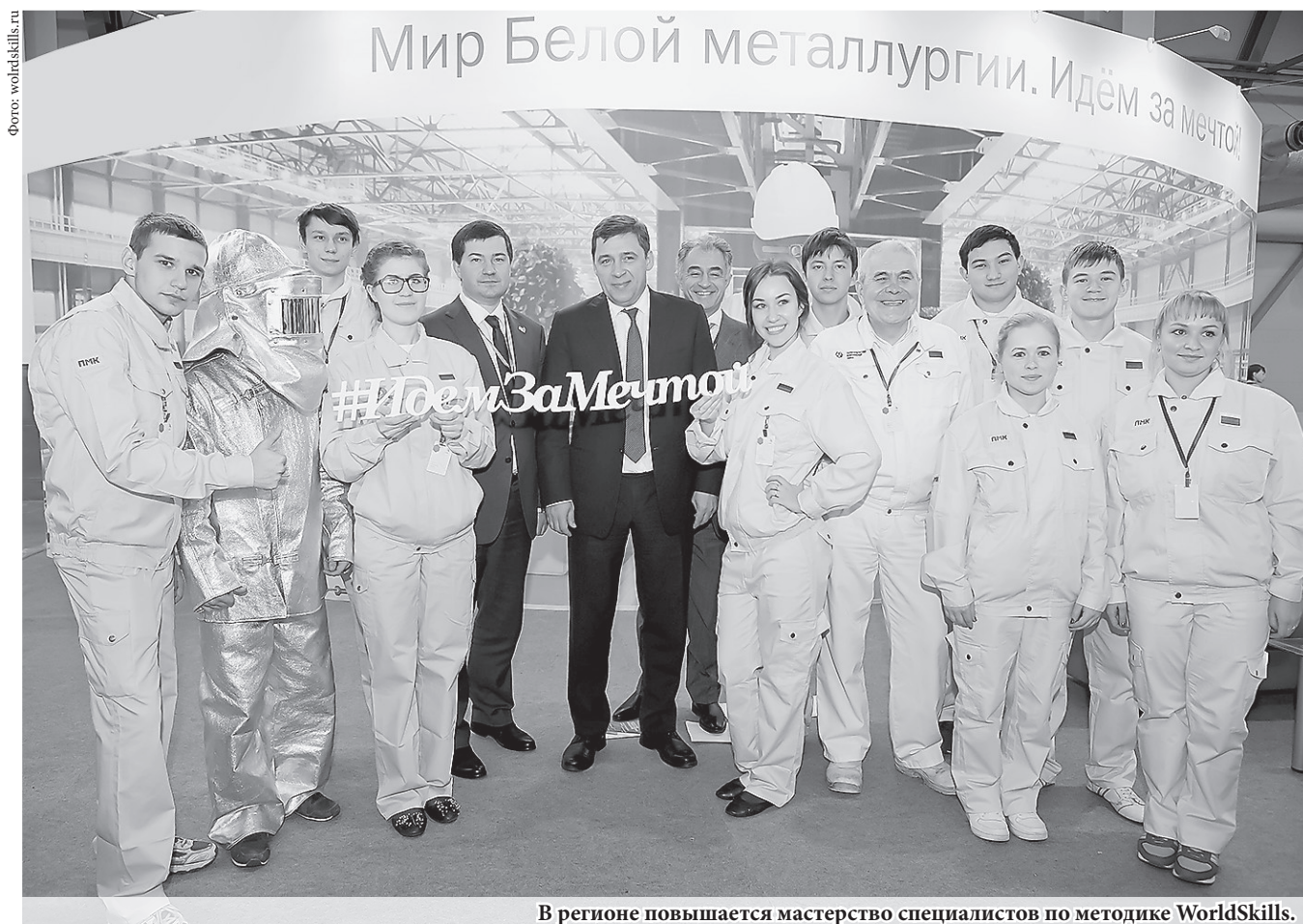
В регионе повышается мастерство специалистов по методике WorldSkills.

Один из резидентов технопарка – компания «НЕКСАН» планирует разместить высокотехнологичное производство промышленных теплообменников. Ещё один резидент – НПО «БиоМикроГели» – будет производить средства для очистки воды и твёрдых поверхностей от комплексных загрязнений, а также бытовую химию.