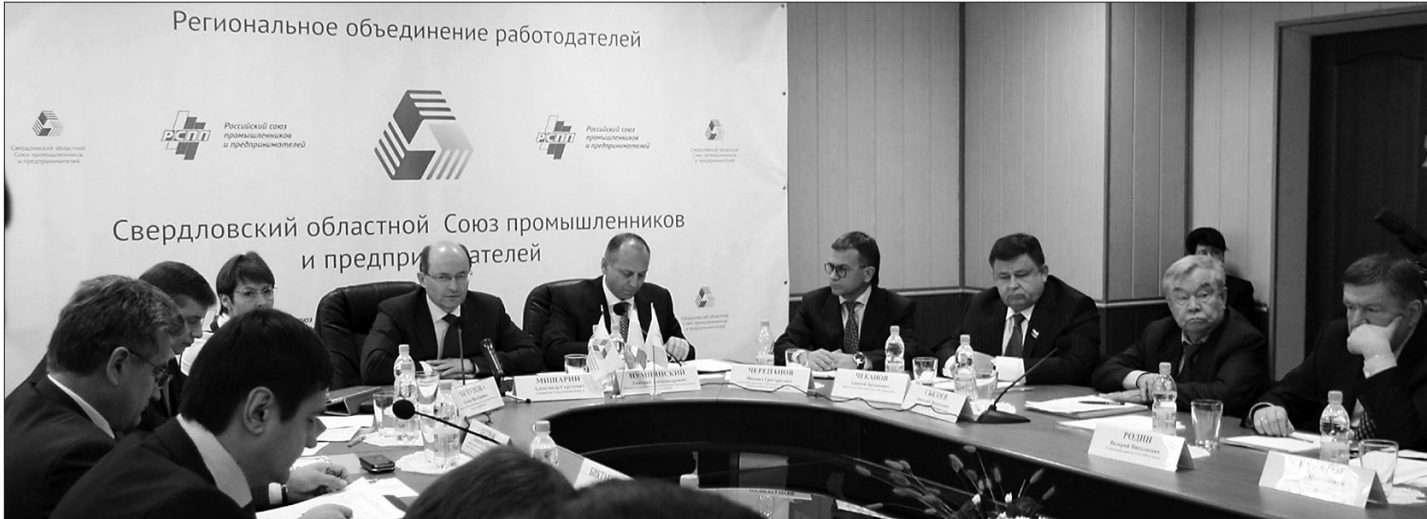
* Участники заседания.

- На заседании президиума совета СОСПП выступил и губернатор Свердловской области А.С. Мишарин, и министр экономики Е.А. Софрыгин – они рассказали о том, как руководство области видит перспективы модернизации экономики округа. К примеру, губернатор предложил создать на территории округа нижнетагильскую агломерацию – объединение промышленно развитых городов, таких, как Нижний Тагил и Верхняя Салда. Мы знаем, что сейчас речь идет о создании такой агломерации вокруг Екатеринбурга. Конечно, такая перспектива открывает перед Тагилом новые возможности, и я думаю, что рано или поздно мы действительно придем к образованию подобной агломерации. Но это не должно быть формально, это должно стать результатом эффективного развития промышленности. Конкретные меры для обеспечения такого развития прозвучали в докладе министерства экономики: речь шла о том, что правительство области должно создать условия для саморазвития территорий, а для этого надо менять и налоговую систему, и