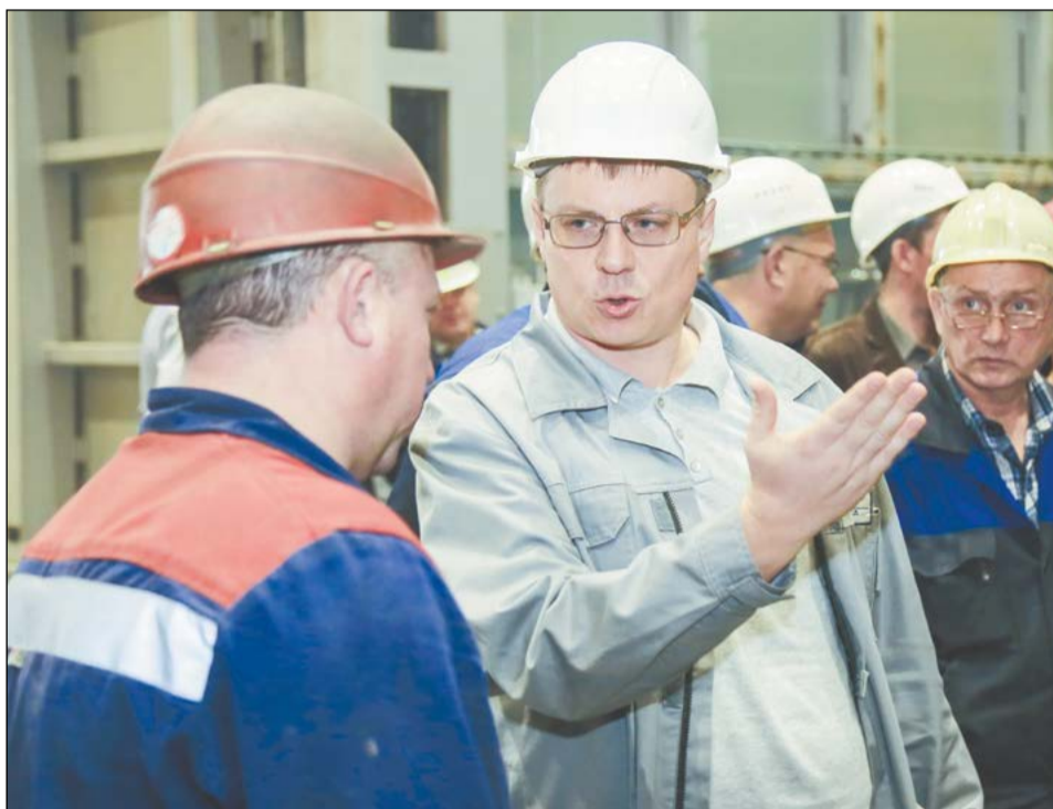
Начальник цеха – не кабинетная должность

– Всё прописывали на схеме цеха, «рисовали стрелочки». Составляли