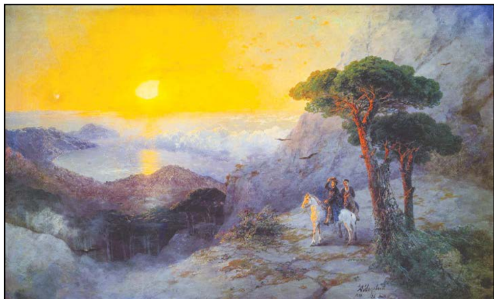
«Пушкин на вершине Ай-Петри при восходе солнца». 1899 год

Десятки картин о Пушкине сотворила рука великого живописца. Некоторые связаны с путешествием опального вольнодумца в Тавриду в 1820 году вместе с семьёй генерала Раевского. Одна из них – «Пушкин на вершине Ай-Петри». Восторженный певец Людмилы и Руслана, сняв шляпу, приветствует рождение дня. Мы тоже ночевали на этой горе. Не потому ли до сих пор видится мне огромный раскалённый диск солнца, его нежные, животворные лучи и просыпающееся море?..