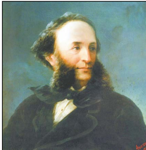
Иван Константинович Айвазовский. 1874 год

Летом 1951 года вместе с группой студентов мне удалось побывать в туристском походе по южному берегу Крыма. Пешком и на автобусе мерили мы километры от Симферополя до Ялты, то поднимаясь на горы Чатыр-Даг и Ай-Петри, то любуясь красотами побережья. Это и были тропы Пушкина и Айвазовского. И те же впечатления, и те же чувства от встречи с морской стихией!